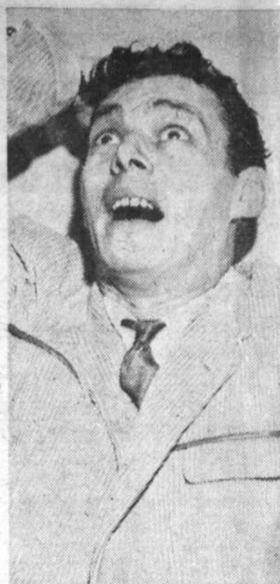
"la caisse de la fin du mois!!!"