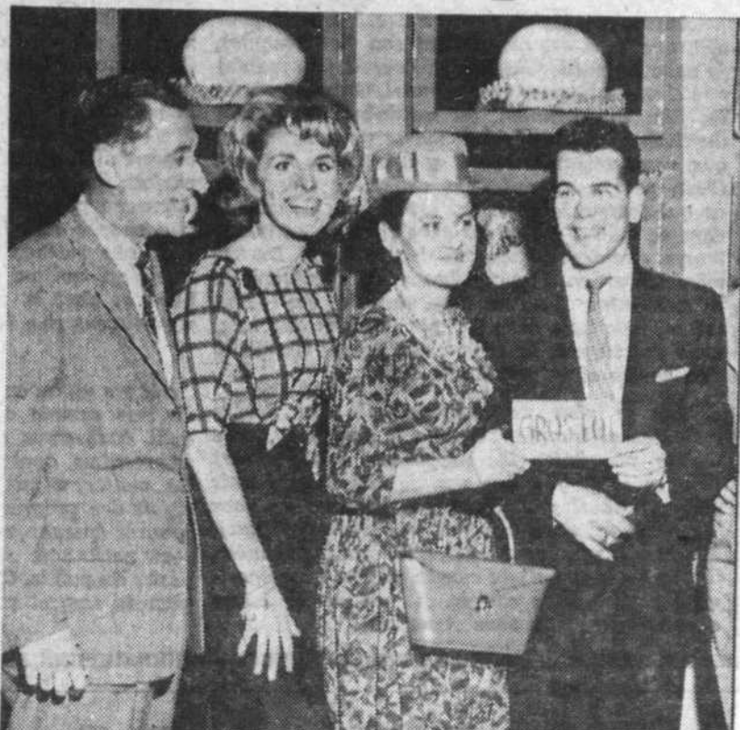
De tous les "quiz" télévisés, "La poule aux oeufs d'or" est sûrement le plus ancien et le plus populaire. A chaque lundi soir, il rallie un nombre record de téléspectateurs. La Molsón paie, sans rechigner, de gros cachets à Baulu et cie et offre une petite fortune en prix. Qu'arrivera-t-il si l'on biffe cette émission de l'horaire ?

On a condamné les "quiz" — va-t-on les bannir de notre radio et de notre télévision? A cette question, je réponds sans embarras: NON! A la suite d'une brève enquête parmi les gens qui m'entourent, je me suis rapidement aperçu que la chose s'avérait impossible... parce que toute l'industrie radiophonique en souffrirait. Des explications s'imposent. Si la popularité de la radio et de la télévision ne doit pas uniquement son salut à ces émissions questionnaires, nous devons avouer qu'elles leur rapportent énormément. Pour s'en convaincre, il nous suffit de jeter un rapide coup d'oeil sur les différentes quotes d'écoute; nous nous convainquons sans difficulté que ces "quiz" justifient pleinement leur présence. Nous savons par exemple, que depuis quelques mois, le canal 10 rallié à Montréal et les environs, un plus grand nombre de téléspectateurs que le canal 2. Sans tenter (loin de moi cette idée) d'amoindrir