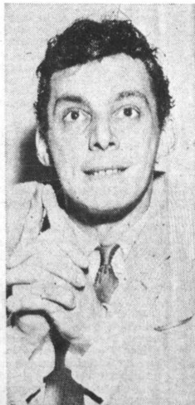
"c'est "La Puis et le Beau Temps".