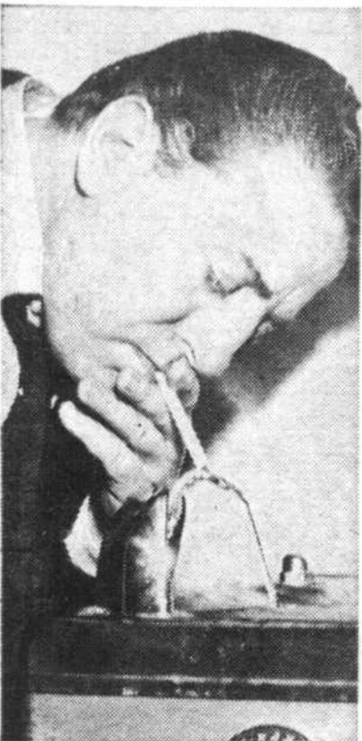
"On peut se méprendre parfois!"