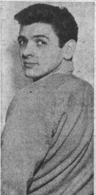
Son vrai nom des Bourgeois...

"Avec la publicité qu'on m'a faite" nous a-t-il dit, "le public s'attendait à trop de moi. Je n'ai pas la prétention de vouloir sur-