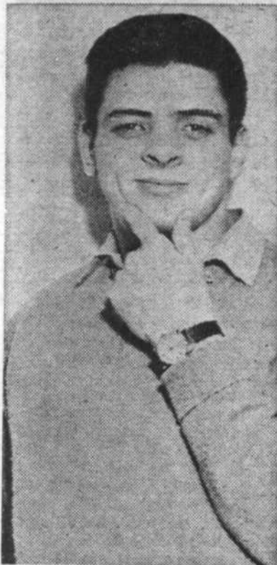
Il y a six mois il était acrobate...