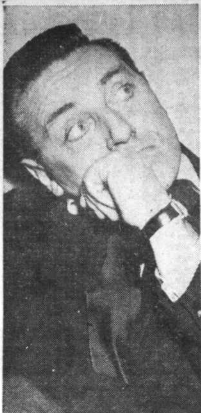
"L'avenir de la Tête de l'Art?"