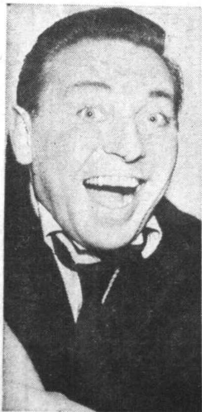
"A la Comédie Canadienne, okay!"