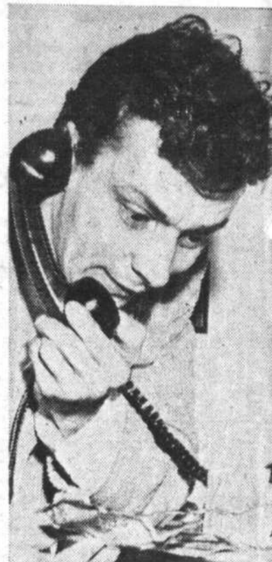
"le P'tit Café? Oui, le 31 du mois"