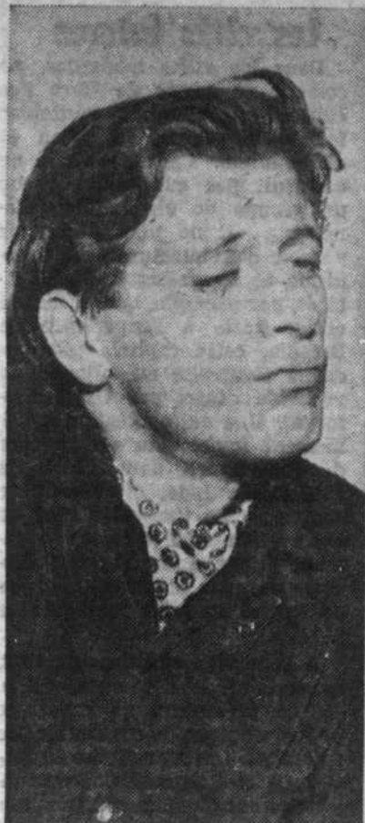
... fuir la facilité en tout et partout !