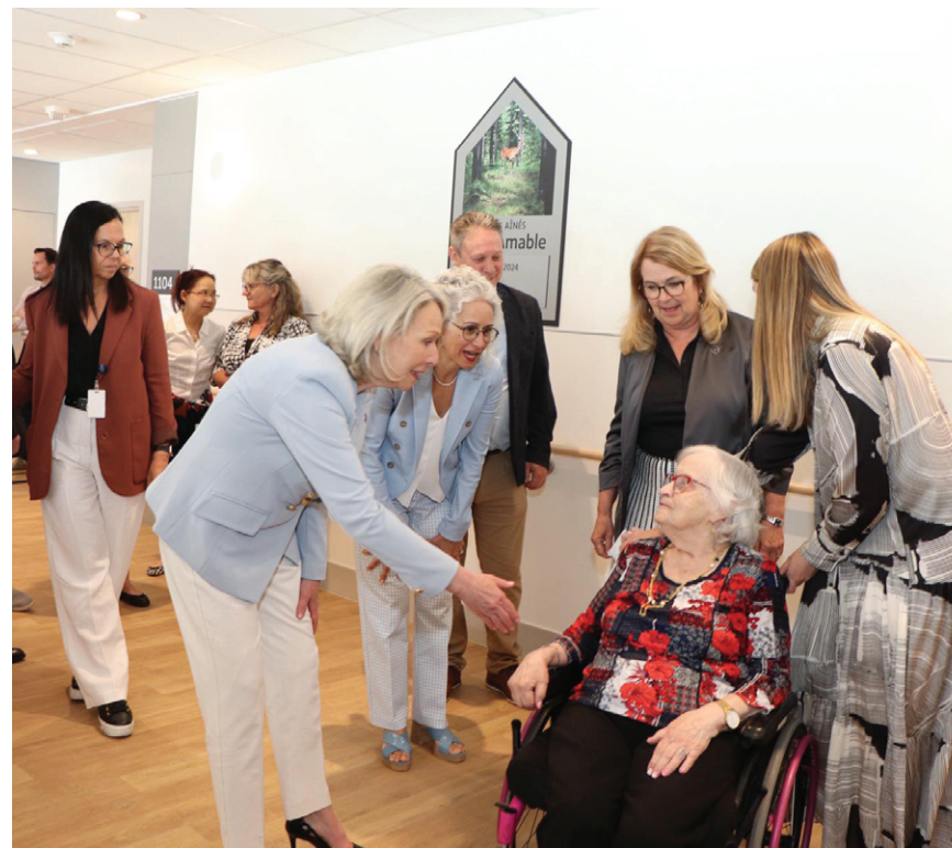
Ce sont 48 personnes sur une possibilité de 72 qui résident présentement dans la nouvelle maison des aînés à Saint-Amable.