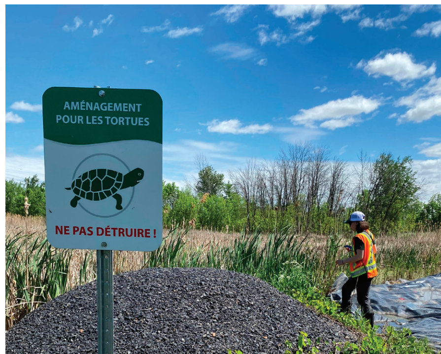
Site de ponte aménagé au parc de la Frayère.

On peut apercevoir les tortues entre 10 h à 13h, au moment le plus ensoleillé de la