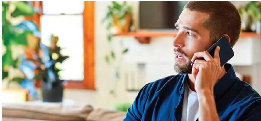
Un vaste sondage de l'UMQ démontre que 46 % des élus disent avoir vécu de l'intimidation ou des menaces.

Parmi les faits saillants du sondage, on remarque que 71% élus considèrent que le climat de travail s'est détérioré depuis les