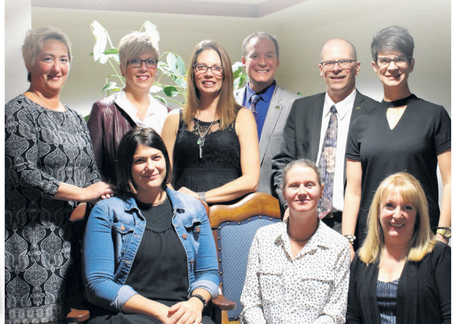
L'École forestière de La Tuque a célébré son demi-siècle d'existence en 2017.