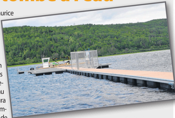
La marina municipale de La Tuque.