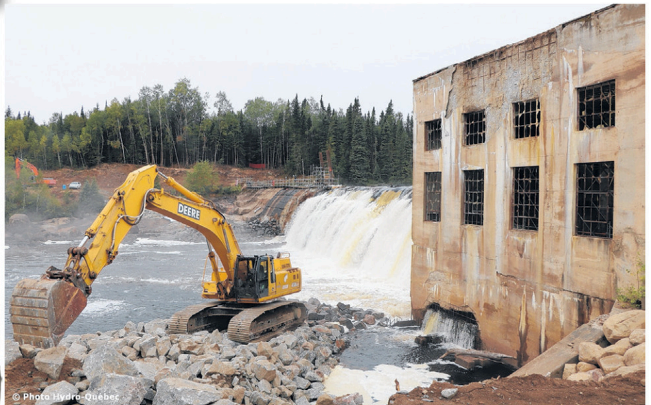
Le barrage de Parent.

l'électricité dans les années 1960. En raison de la faible hydraulité de la rivière Bazin, la société d'État n'a jamais opéré le site. Hydro-Québec prévoit mettre la touche finale à ce chantier au printemps 2018 alors que des arbres et arbustes seront plantés afin que la nature y reprenne plus rapidement ses droits. Soulignons que le coût des travaux est estimé à 2,7 millions $. Les 14 200 m 3 de béton du barrage seront concassés et transportés à La Tuque pour être recyclés dans des ouvrages municipaux.