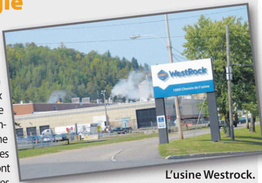
L'usine Westrock.

Les 240 salariés de l'usine Westrock, affiliés au local 530, ont accepté les offres salariales, non sans d'abord avoir demandé à la partie patronale de retourner à la table des négociations. Le facteur monétaire était le point en litige. En présence d'un médiateur, les deux parties en sont venues à une entente, acceptée à 82%. Les travailleurs obtiendront des augmentations salariales. Des améliorations au régime de retraite, dans les vacances et les assurances collectives sont aussi prévues. Les travailleurs ont droit à des améliorations aux clauses normatives.