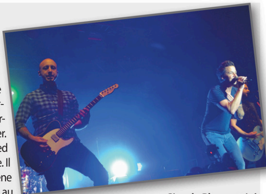
Simple Plan a attiré 8000 personnes à La Tuque à l'été 2017.

Le spectacle du groupe Simple Plan a clôturé l'édition 2017 des Jeudis Centre-Ville de majestueuse façon. On évalue à 8000 personnes la foule, devant la scène du groupe international, à l'angle des rue St-Joseph et Tessier. Un système de navettes avait été mis sur pied pour amener tout le monde vers le centre-ville. Il aura fallu plusieurs jours pour aménager la scène et tous les équipements techniques. Quant au groupe, il a livré une généreuse prestation devant ses fans. «On s'est préparé pour La Tuque», a dit le groupe d'une même voix, visiblement heureux de pouvoir se produire dans une petite région. Sans leur bassiste, Simple Plan a rencontré les autorités municipales de La Tuque, les organisations et