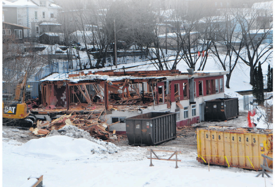
Les travaux ont été entamés en début décembre.