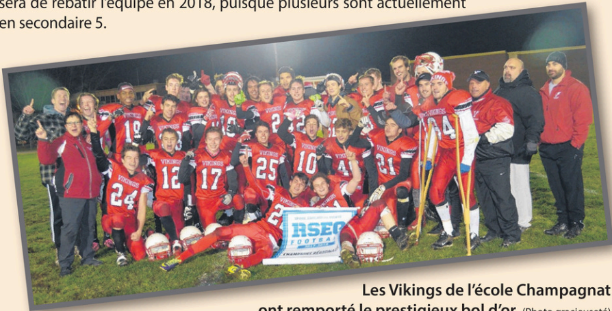
Les Vikings de l'école Champagnat ont remporté le prestigieux bol d'or.

Après une saison facile, contre Shawinigan, les Vikings de l'école Champagnat ont remporté le prestigieux bol d'or, eux qui ont avoir disposé l'Arsenal du Collège Nouvelles-Frontières de l'Outaouais par la marque de 23-22, en finales interrégionales. Une première en neuf ans pour les Vikings qui l'emportent en toute fin de match, alors qu'ils tiraient de l'arrière 22-21. Ils auraient pu se laisser distraire en raison d'une saison assez facile contre Shawinigan, mais au contraire, ils ont redoublé d'efforts. Cette année, ils étaient 26 juvéniles dans les rangs. Le défi sera de rebâtir l'équipe en 2018, puisque plusieurs sont actuellement en secondaire 5.