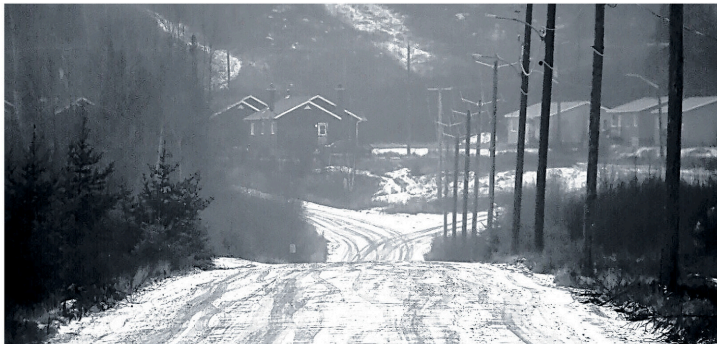
Le programme permet le rachat des maisons où les gens vivent actuellement, ou la construction de nouvelles résidences dans la communauté.

D'ailleurs, pour répondre aux questions de la population, une semaine de l'habitation a eu lieu tout dernièrement au Centre des chefs des territoires de Wemotaci. Différents