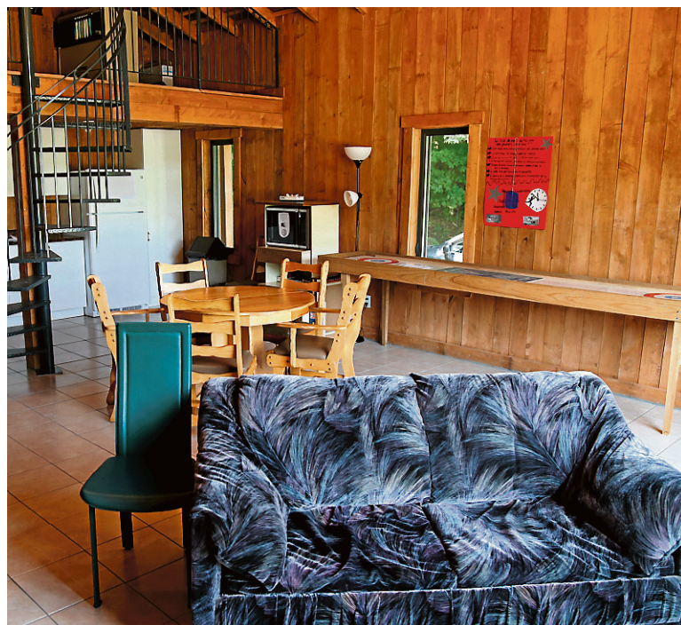
Le Chalet accueille un coin salon, des tables de jeu de toutes sortes et un punching-bag . Trois chats animent également l'environnement.