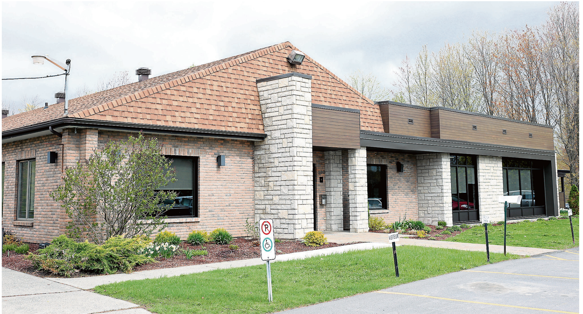
Un peu plus de 410 000 $ ont été investis pour agrandir l'hôtel de ville de Saint-Alphonse depuis deux ans.