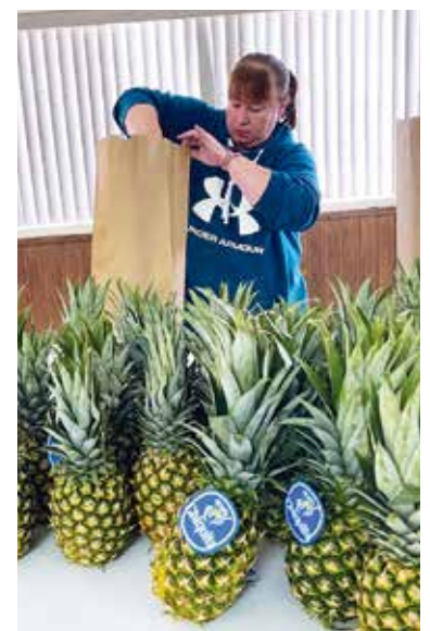
Les citoyens qui désirent recevoir un sac en février ont jusqu'au 13 février pour le commander. Photo contribution

En plus de préciser que la deuxième phase du programme Mangez frais Nord-Ouest ( https://www.mangezfriseatfresh.ca ) verra le jour à Edmundston et à Haut-Madawaska au cours de l'automne 2024, Mme Côté indique que les gens ont jusqu'au 13 février pour commander leur prochain sac de fruits et de légumes.