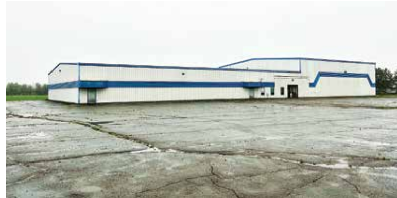
Le rapport du comité de travail – Infrastructure 100 rue Vétéran «fait état de la non-viabilité du bâtiment dans son état actuel».

Par l'entremise d'un communiqué, la Municipalité régionale de Grand-Sault (MRGS), le comité recommande notamment au conseil de récupérer et de vendre l'équipement viable qui se trouve à l'intérieur de l'édifice et que l'argent recueilli de ladite vente soit mis de côté pour le projet futur; de faire analyser la structure métallique de l'édifice et se faire confirmer sa durée de vie versus la construction d'une structure neuve et de rendre disponible l'équipement de cinéma à tout organisme ou entrepre-