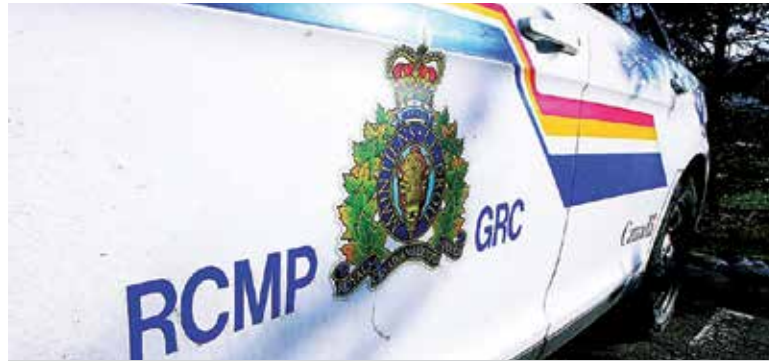
La GRC sollicite l'aide du public afin de résoudre deux enquêtes.

La police publie maintenant des photos tirées d'une caméra de surveillance en espérant que quelqu'un reconnaîtra