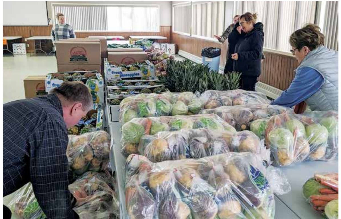
Le programme Mangez frais Nord-Ouest a vu le jour à Vallée-des-Rivières et dans la Municipalité régionale de Grand-Sault.

Mme Côté rappelle également quelques-uns des objectifs du programme Mangez frais Nord-Ouest. Parmi ces derniers, on compte le fait d'offrir des aliments abordables aux individus et aux familles, de créer des activités inclusives pour les bénévoles et de collaborer avec les écoles de la région.