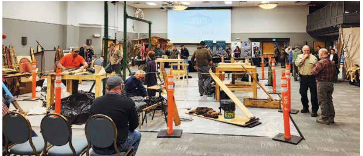
Des centaines ont circulé parmi les stands durant le colloque annuel de la Fédération des trappeurs et récolteurs de fourrures du Nouveau-Brunswick.

viser haut. Lorsque j'ai dit que 250 personnes seraient de la partie, les gens étaient sceptiques, car ce banquet rassemble une centaine de personnes. Finalement, nous n'avions plus de billets à vendre depuis la mi-octobre.»