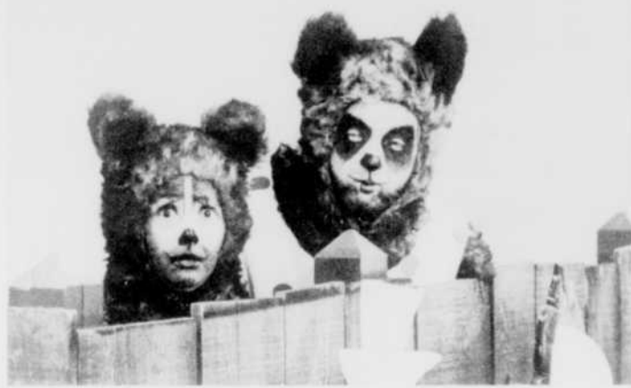
Un couple inséparable: Raminat (Lionel Villeneuve) et Jujube (Louissette Dussault).

Pour s'en convaincre, on n'a qu'à penser au joyeux groupe de personnages avec qui les jeunes téléspectateurs s'amuse toutes les semaines: bien