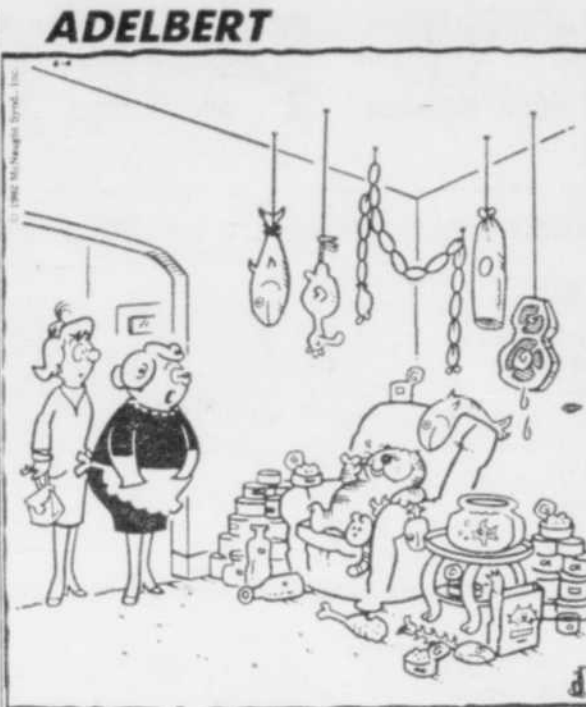
C'est son coin préféré.