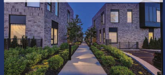
302, RG DES VINGT APP. 13 SAINT-BASILE-LE-GRAND