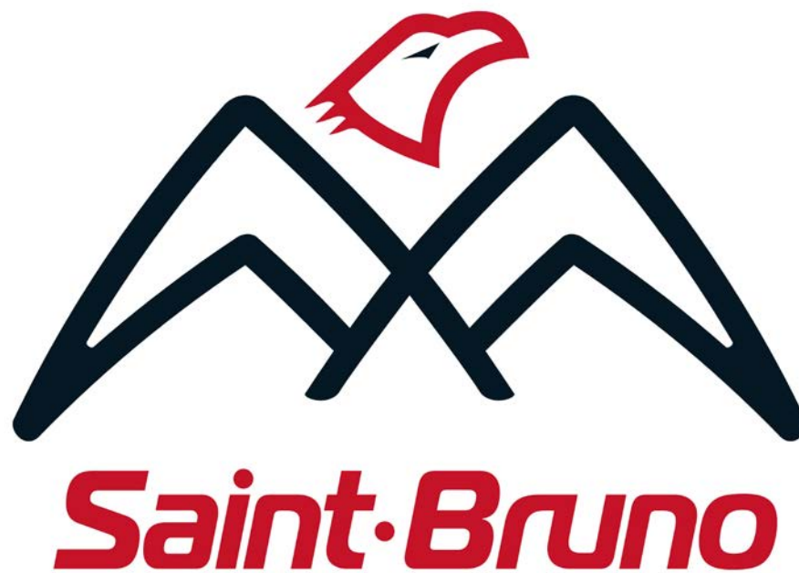
Le nouveau logo dévoilé.

« Pour les jeunes, porter un chandail au goût du jour, qui les valorise et les rend fiers, est