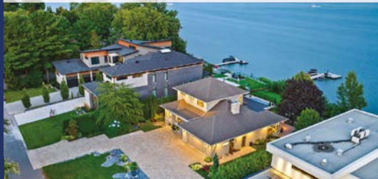
2141, DES ROSES CARIGNAN