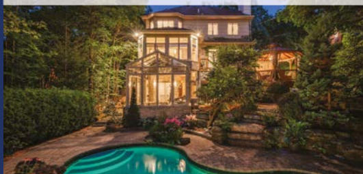
53, AVENUE DU BEL-HORIZON SAINTE-JULIE