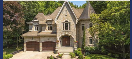
1432, FRANÇOIS-P.-BRUNEAU SAINT-BRUNO-DE-MONTARVILLE