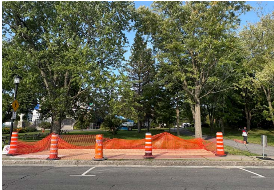
Un nouvel abribus sera implanté sur la rue Montarville.

Des travaux sont en cours sur la rue Montarville afin d'implanter un nouvel abribus du Réseau de transport de Longueuil. L'infrastructure sera située devant l'église de Saint-Bruno-de-Montarville.