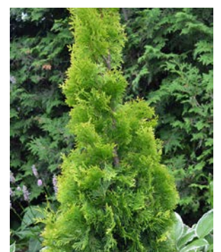
Thuja occidentalis Jantar

Par exemple, une rangée dense d'arbres peut stopper de six à huit décibels.