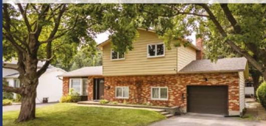
1483, EVERGREEN SAINT-BRUNO-DE-MONTARVILLE