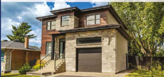
7, DES PINS SAINT-BASILE-LE-GRAND