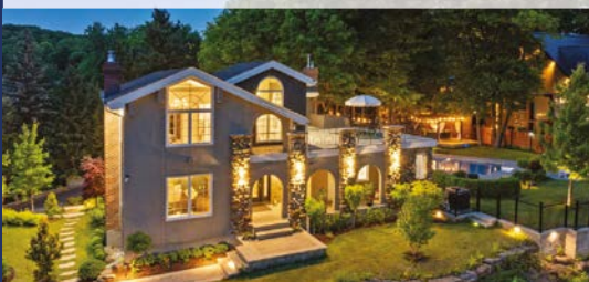
901, CHEMIN DES HIRONDELLES SAINT-BRUNO-DE-MONTARVILLE