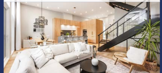
302, RG DES VINGT APP. 13 SAINT-BASILE-LE-GRAND