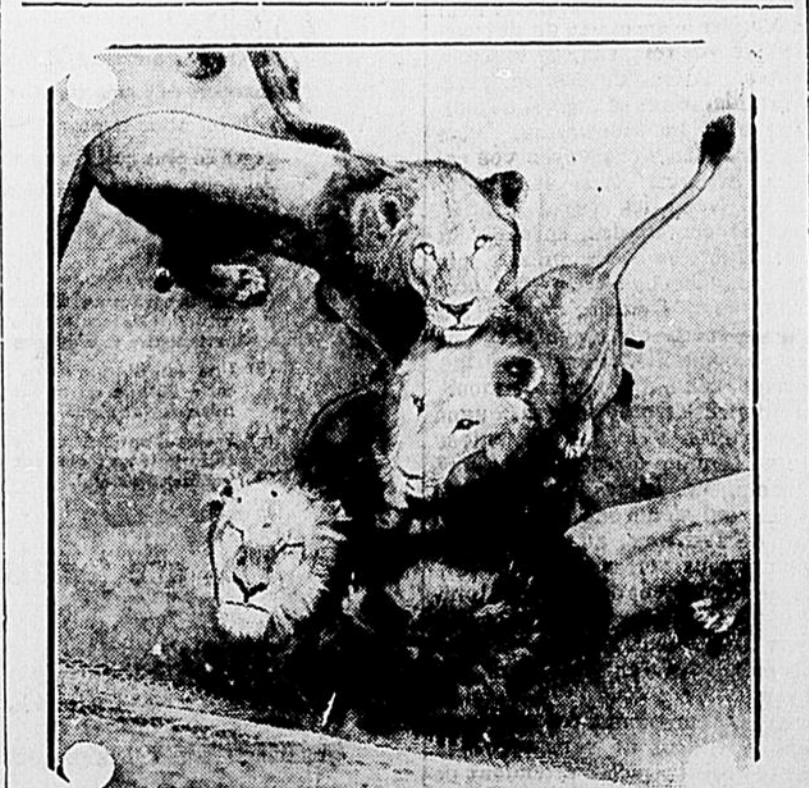
Une famille de jeunes lions bien inoffensifs aujourd'hui, mais laissez-les grandir et c'est vous qui en aurez peur.