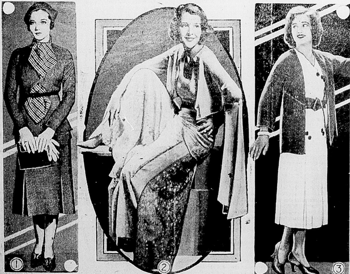
1) Charmant tailleur, brun et blanc pour les jours chauds. 2) Crêpe rose avec écharpe imprimée, pour la chambre. 3) Ensemble délicieux de couleurs bleu-marine et blanche avec ceinture à boucle nouvelle.