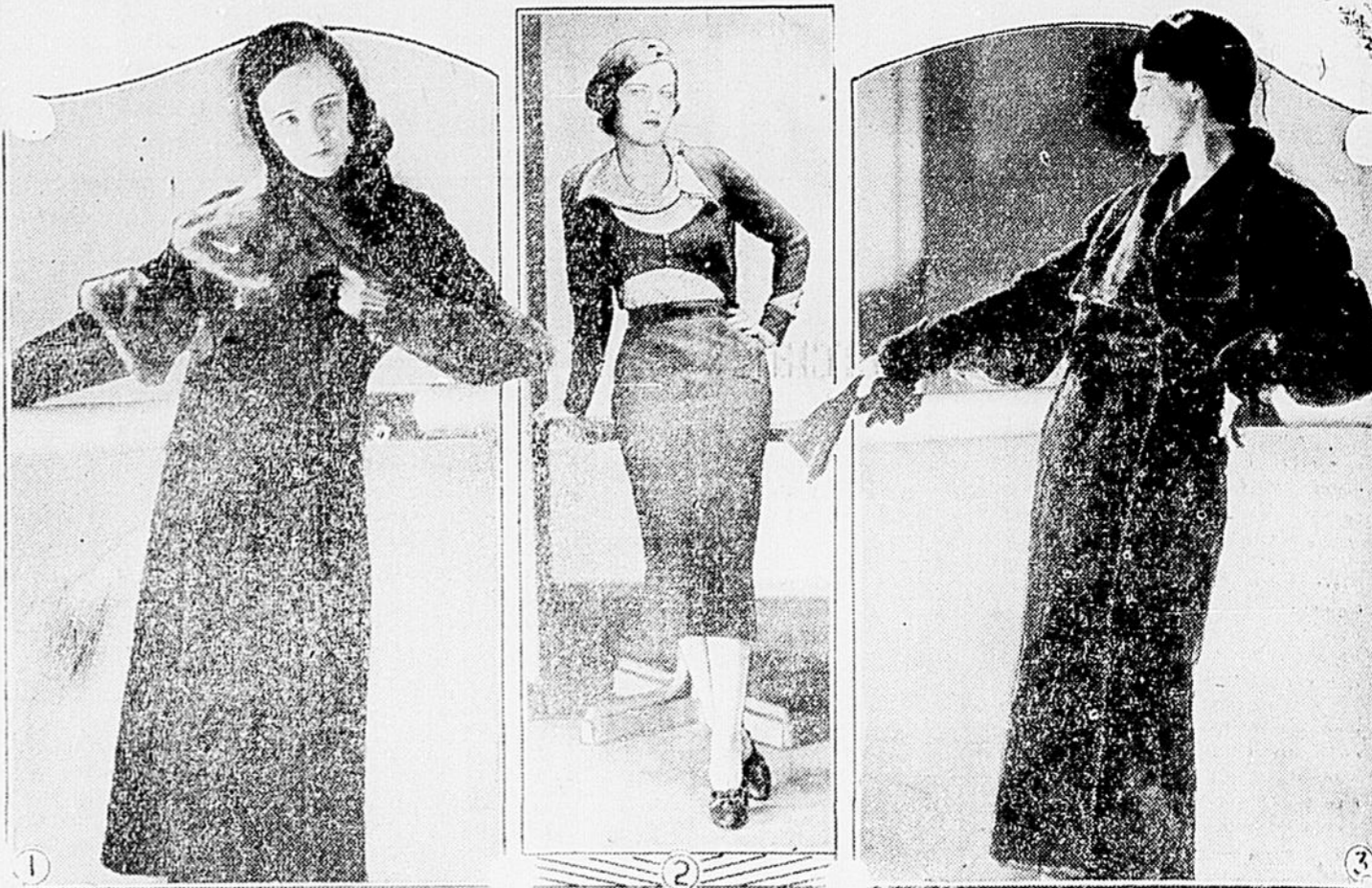
1) Modèle en seal d'Alaska noir avec tour de cou et manches tout à fait caractéristiques. 2) Joli ensemble tout laine avec blouse travaillée, manche longue, la grande nouveauté de l'automne. 3) Manteau en seal d'Alaska brun, col ouvert, manches larges et bouffantes, ligne de taille par fermoir à bouton.