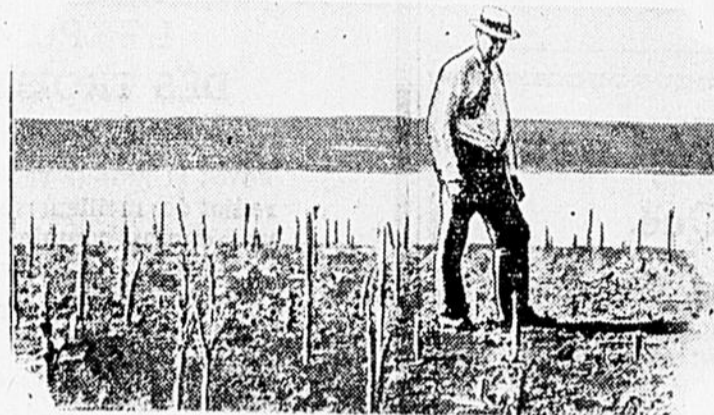
Ce qui reste d'un champ de blé d'Inde après le passage des sauterelles.

Voici les prix actuels au marché Bonsecours: OEUFs: Frais extra, 30c; Oeufs frais, 28c; Frais premiers, 28c; Frais seconds, 25c. BEURRE: morceau d'une livre, moules plats, Tip-Top, 24c; 56 lbs, 25c; Cuisine, solide, 19c. FROMAGE: Doux, Québec, Environ 20 livres, 12c; Au morceau, 12c; Meules, 5 livres, 14c; Fort Canadien, Environ 80 lbs, 10c; Au morceau, 20c; Oka, des Trappistes, 29c; Roqueforts, 19c; Gruyère, à la livre, 47c; Crème de Gruyère, doux, $2.85; Tip-Top, boîte de 5 lbs, 23c. POIS: Blancs, 3c; Cassés, 5c. FEVES: Blanches, le minot, 1.60. SIROP D'ERABLE: $2.25 le gallon. Sucre d'érable, 18c la lb. MIEL: brun, 30c, 8c; blanc, 30c, 9c. GRAISSE PURE: timette, 60 lbs, 94c. Seau de 20 lbs, 93c.