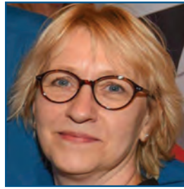
PAR NICOLE BÉLANGER, PRÉSIDENTE