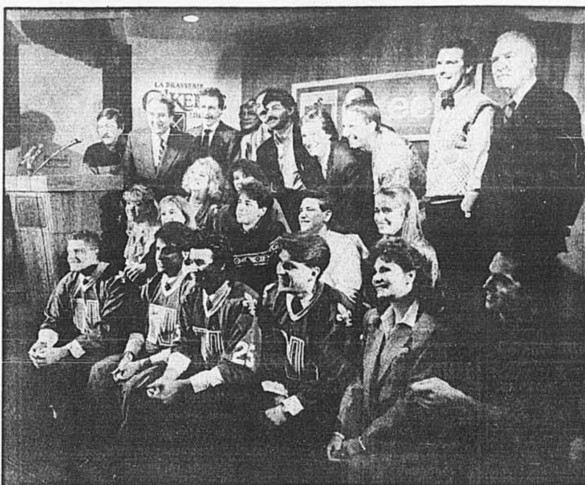
Les anciens (ils n'étaient pas tous présents) et les nouveaux de Lance et compte 3, lors de la conférence de presse d'hier.

Téléfilm Canada assurera une partie du financement (31 pour cent au lieu de 45 pour la 2), mais Radio-Canada paiera 20 pour cent de plus que cette année. Par ailleurs, Métro-Richelieu se joindra aux commanditaires Ultramar, O'Keefe et Le Permanent. Allô allô, parions