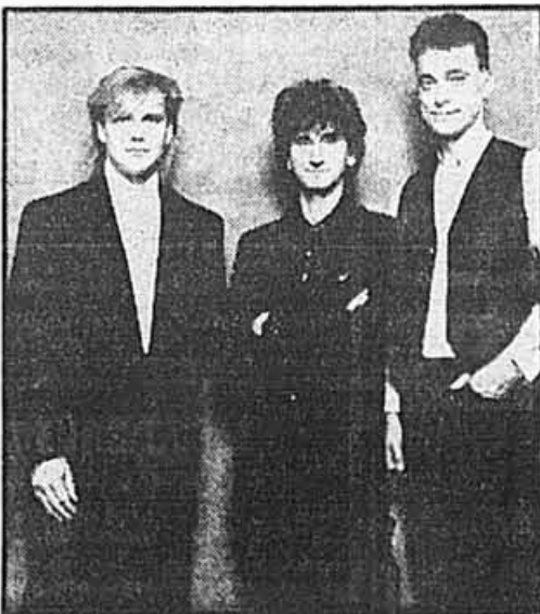
Rush, le trio torontois qui se produira au Forum demain soir en compagnie de Chalk Circle.

«Je ne suis pas fou de toute la technologie, affirme Peart. C'est un outil que je dois utiliser comme je me sers d'un traitement de texte à la maison, mais je n'ai pas le même contact physique avec tout ça qu'avec ma