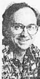
ALAIN DE REPENTIGNY

Rush est l'un des rares groupes «progressifs» des années 70 qui n'a pas eu à s'éclipser quand le raz-de-marée punk a fait son oeuvre. Faut dire que le trio torontois, qui se produira au Forum demain soir en compagnie de Chalk Circle, n'a pas chômé depuis ses débuts, lançant un microsillon par année et multipliant les tournées qui lui ont permis de recruter un public fidèle. Pour tout dire, on a rarement connu un groupe aussi peu à la mode que Rush.