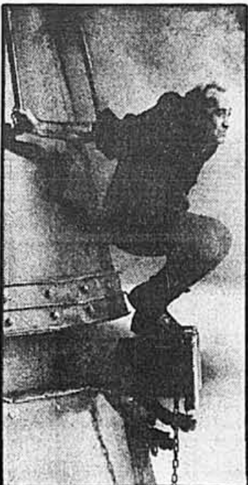
Le Train, un vidéo de François Girard.

Il s'agit de quatre films de Bernar Hébert: Rooms qui sera présenté en première à Hong Kong, Le chien de Luis et Salvador, Exhibition, et LaLala Human Sex, duo no 1, aussi un vidéo clip de François Girard, Fog Area avec un Michel Lemieux (à voir le 16 mars au Métropolis) atterrir en parachute dans une ruelle habitée par d'étranges personnages! Du même réalisateur, Le train qui avait remporté le Merit Award au festival de Tokyo en 85, et aussi Absence, de Suzan Ryland; et Oh nothing, de Dennis Day.