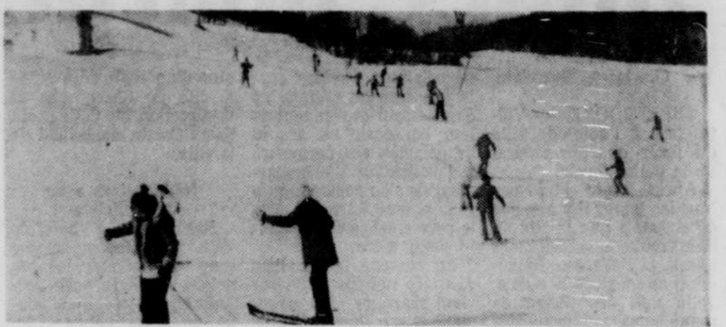
C'est l'heure du ski, quelques fois ça peut être difficile et douloureux, mais c'est toujours intéressant...

Le programme de ces classes se divisait en trois parties. D'abord les élèves ont observé la faune et la flore très riches dans cette région. Par cette observation, les jeunes apprendront à connaître la nature sous ses divers aspects. La deuxième partie de ces classes