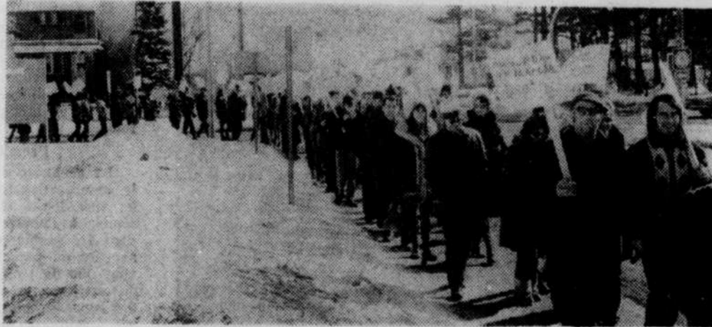
MANIFESTATION — Plus de 200 membres du Syndicat de la fonction publique du Québec de Drummondville s'étaient réunis en face de l'édifice provincial de la rue Marchand, hier midi, dans le cadre de l'Opération débloccage.

Mentionnons en terminant que le Syndicat des fonctionnaires provinciaux du Québec compte 30,000 des quelque 250,000 membres du front commun provincial.