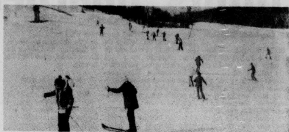
C'est l'heure du ski, quelques fois ça peut être difficile et douloureux, mais c'est toujours intéressant...