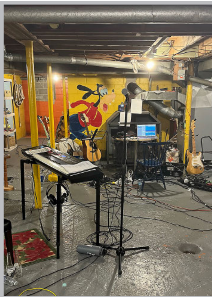
► Le studio que les musiciens se sont construits.

«J'aime beaucoup le vieux rock et l'orgue. J'ai toujours trouvé que c'était un instrument qui sonnait bien. Je me suis dit que ce serait mon instrument et j'ai commencé à apprendre le piano en mars 2022. Il a fallu que je pratique beaucoup. [...] Sur l'album, j'allais selon ce que j'étais capable de faire et je me suis surpris énormément parce que ça faisait quatre mois que j'en jouais. C'est une belle réussite personnelle dans un délai aussi serré.»