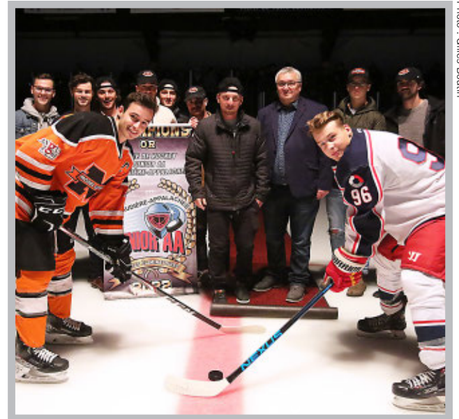
➤ Le Model de Lotbinière a remporté son match d'ouverture à domicile.