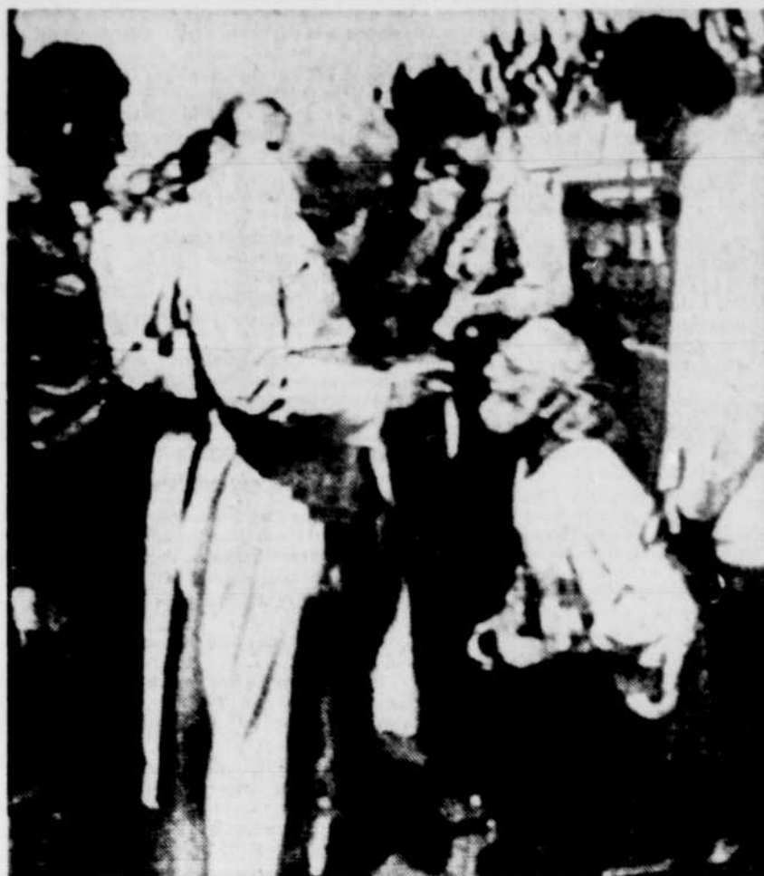
L'abbé Ernesto Cardenal, ministre de la Culture dans le gouvernement sandiniste du Nicaragua, s'agenouille devant Jean-Paul II. La photo a été prise à partir d'un écran de télévision. Le pape n'a par ailleurs toujours pas décidé s'il annulerait sa visite au Guatemala prévue pour lundi.

Dans une brève déclaration, le pape a fait référence à ces mesures dures, visant à contrôler les mouvements de la population, en saluant ceux "qui auraient voulu venir mais ne le peuvent".