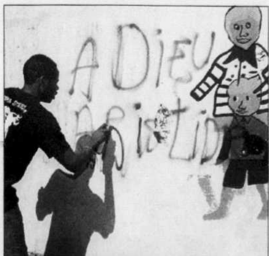
Un message clair et net: Aristide doit partir!