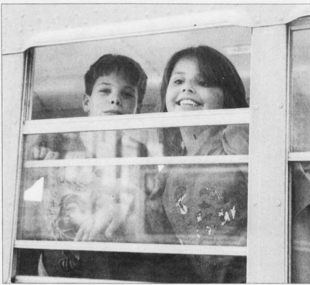
Une société solidaire veut la liberté, mais elle veut la liberté pour tous, pas seulement la liberté des riches. Par exemple, une école publique qui ouvre les horizons de tous les enfants, quels que soient leur milieu d'origine ou la famille dans laquelle ils naissent

Certains principes, certaines valeurs ne peuvent pas être sacrifiés au nom du changement. La liberté est sans aucun doute la valeur la plus importante pour un individu. Mais la recherche de la liberté, qui tient compte du désir d'autonomie personnelle, de la nécessaire reconnaissance de l'effort et du sens des responsabilités, ne peut être dissociée de la lutte pour la justice sociale. Une société solidaire veut la liberté, mais elle veut la liberté pour tous, pas seulement la liberté des riches. Par exemple, une école publique qui ouvre les horizons de tous les enfants, quels que soient leur milieu d'origine ou la famille dans laquelle ils naissent, un système de santé pu-