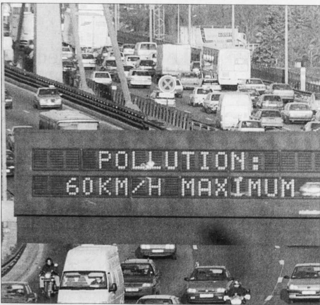
Petite heure de pointe sur une autoroute de Paris: pollution, quand tu nous tiens.

À la faveur de Kyoto, le vent semble en train de tourner. Deux ans après la décision de l'Allemagne de sortir du nucléaire vers 2020, le gouvernement suédois vient de repousser la fermeture de ses installations de 2010 à... 2040! En 1980, les Suédois avaient pourtant décidé par référendum d'en finir avec le nucléaire.