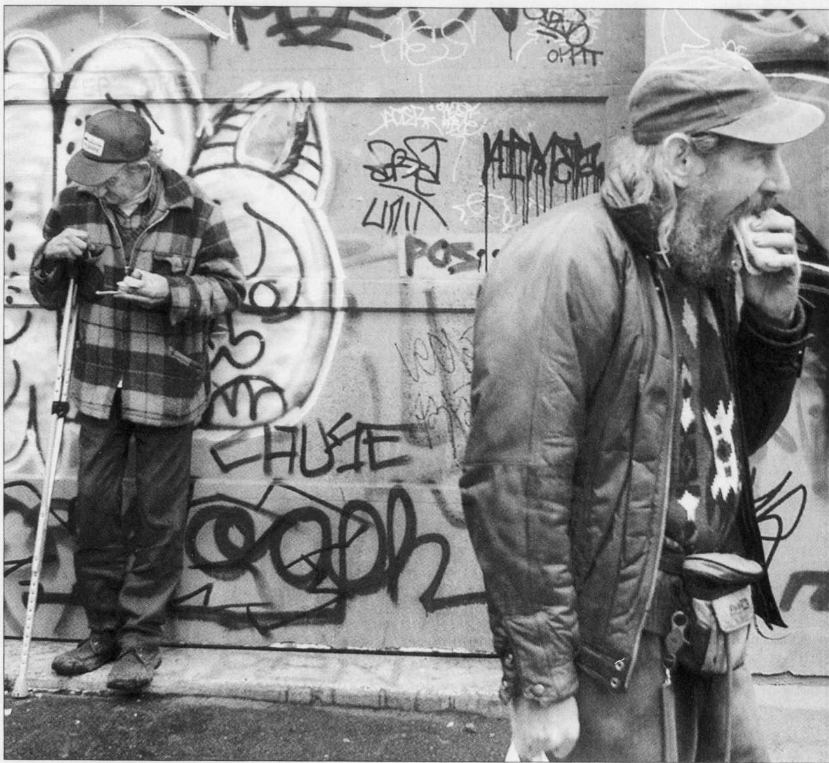
Un îlot de pauvreté égaré dans une mer de statistiques.