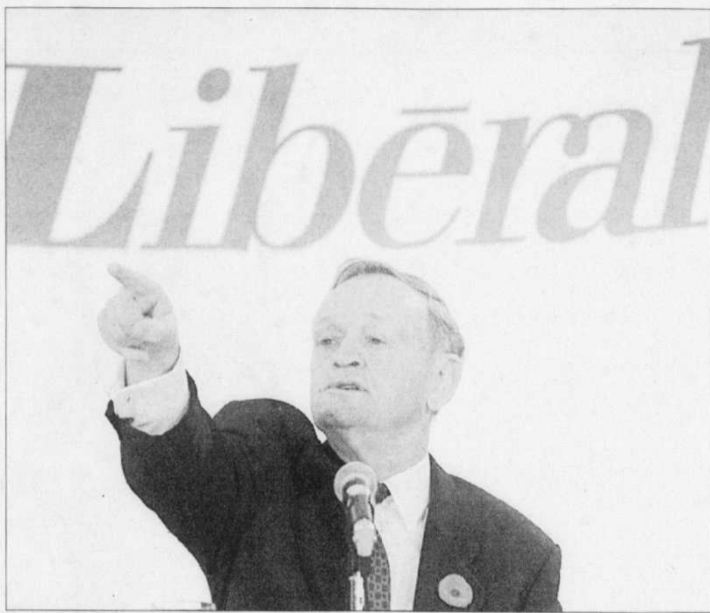
Jean Chrétien «Après l'élection de l'an 2000, nous avons gagné la majorité des voix et presque la majorité des sièges, et Lucien Bouchard a démissionné par la suite, en voyant là, comme il disait, un signe que les Québécois et les Québécoises choisissaient encore une fois le Canada.»

D'ailleurs, Washington a récemment multiplié les commentaires assassins à son endroit. Le 30 octobre, après que des centaines de boat people haïtiens eurent débarqué sur la côte de Floride devant les caméras de télévision, l'émissaire américain à l'OEA, Roger Noriega, a menacé de considérer Haïti comme «un État paria» et Jean-Bertrand Aristide