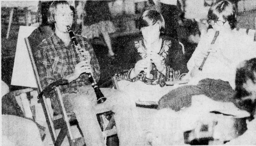
Passer 24 heures sur une chaise à se bercer... il faut le faire. Huit jeunes de l'Harmonie de Thetford Mines ont amassé des fonds pour leur groupe musical. Toutes les façons étaient d'ailleurs bonnes pour relever ce défi.

En somme, la décision d'effectuer ces travaux appartient aux contribuables et l'assemblée du 20 septembre prochain leur en donnera l'occasion. Toutefois, il serait étonnant que ces travaux soient refusés surtout en songeant que la municipalité est assurée d'une subvention du ministère des Affaires municipales au montant de $456,440.