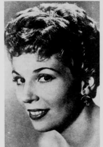
Au cours de la prochaine émission de Music-Hall , dimanche 26 janvier, à 8 heures du soir, les téléspectateurs auront l'avantage de voir et d'entendre une autre vedette française de la chanson, VICKY AUTHIER. Excellente musicienne, celle-ci s'accompagnera elle-même au piano lors de son tour de chant.

C'est un peu de tout cela qu'on parlera Au P'tit café , le 28 janvier. On se doute bien que les turbulents animateurs de la boîte, Normand Hudon, Dominique Michel et Pierre Thériault, ne manqueront pas cette occasion unique de se payer la tête du seul réalisateur qui soit en vedette à sa propre émission.