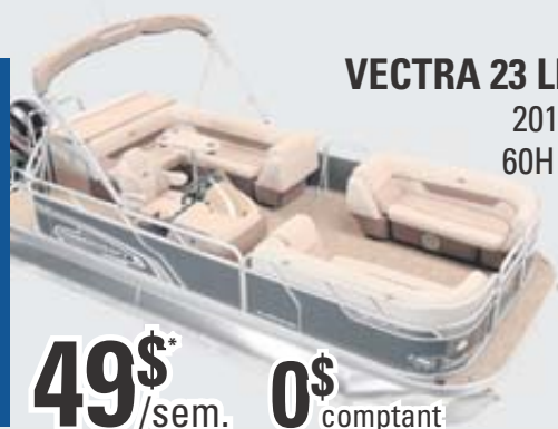
VECTRA 23 LE 2018 60HP