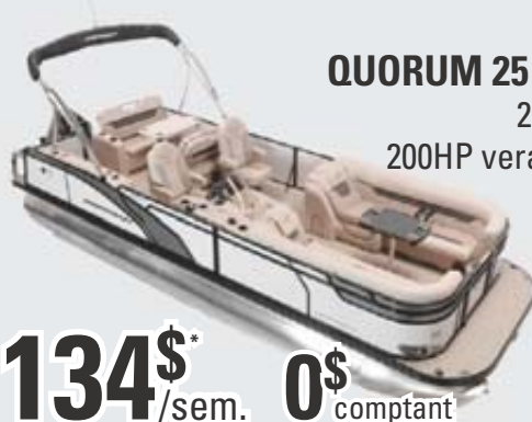
QUORUM 25 RL 2019 200HP verado