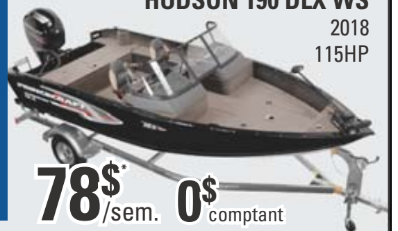
HUDSON 190 DLX WS 2018 115HP