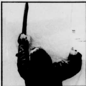
"Le Grand Nord"

Enfin, les téléspectateurs qui suivront la série le Grand Nord verront les animaux sauvages de l'Arctique, sauront tout sur certains explorateurs, apprendront