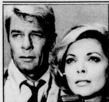
Deux vedettes de "Mission: impossible", Barbara BAIN et Peter GRAVES.