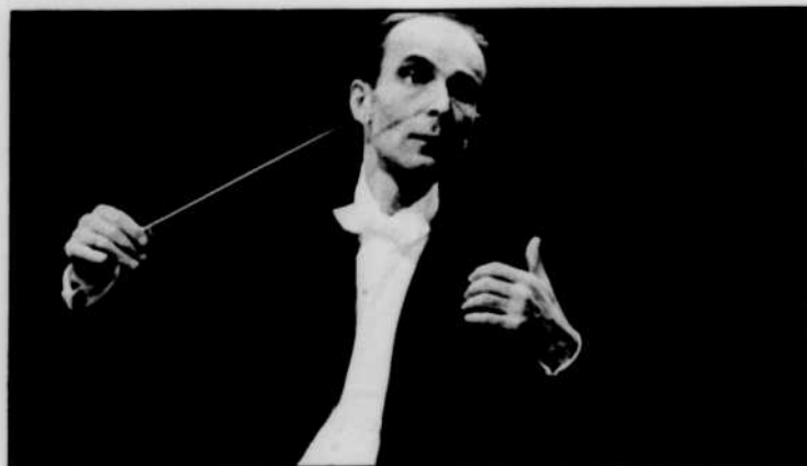
Igor MARKEVITCH aux "Chefs-d'oeuvre", lundi à 16 heures.