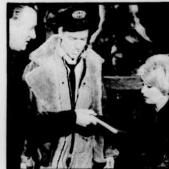
"Zéro, un, Londres"

Les agents de Zéro, un, Londres sont sans cesse confrontés à des problèmes aussi nombreux et complexes que ceux d'une grande ville: tragédies, comédies, drames, amours, intrigues et aventures. Si on aime les émotions fortes, c'est une série à ne pas manquer.