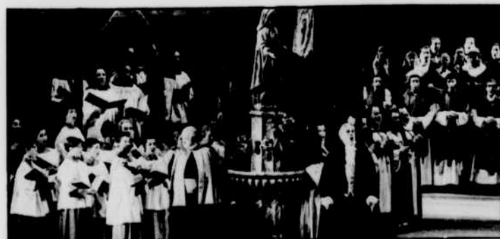
Le premier acte de "La Tosca", avec Gabriel BACQUIER et Fernando CORENA.

Les rôles principaux de cet opéra en trois actes seront chantés par Régine Crespin (la Tosca), Gianni Raimondi (le peintre Cavaradossi) et Gabriel Bacquier (le ministre de la police, Scarpia). Régine Crespin et Ga-