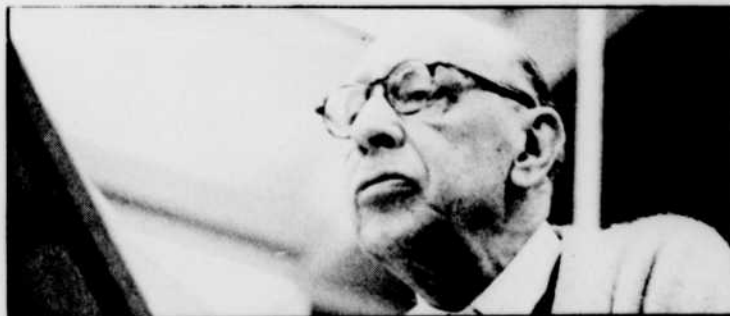
Deux oeuvres de Stravinsky, dimanche matin à 8 h 05.