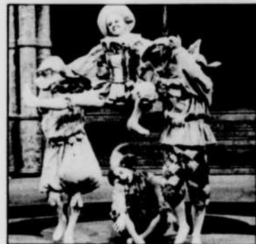
Des membres du Ballet national du Canada

Déjà présenté et acclamé au Centre O'Keefe de Toronto, à Washington, au Festival mon-