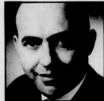
Hon. Clément VINCENT

Le ministre de l'Agriculture du Québec, M. Clément Vincent, participera à la première émission, ayant été invité à présenter la série. Cette première émission, présentée sous la rubrique Nécessité de la gestion de ferme , tracera un portrait de la ferme moyenne au Québec. On parlera aussi de l'évolution de l'agriculture qui impose à l'agriculteur de reviser ses concepts et ses méthodes.