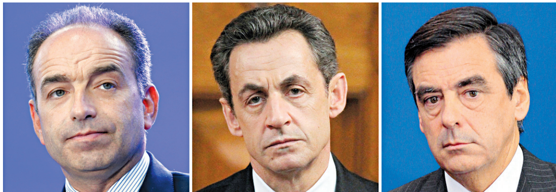
De gauche à droite, Jean-François Copé, Nicolas Sarkozy et François Fillon

François Fillon semble quant à lui brusquement sorti de la naïveté dont il a fait preuve tout au long de cette campagne. Il brandit aujourd'hui la menace de fonder un nouveau groupe parlementaire indépendant, ce qui priverait l'UMP d'environ 70 députés (contre 135 chez Copé). L'UMP perdrait ainsi une cagnotte qui pourrait se monter à 6 millions d'euros, chaque député