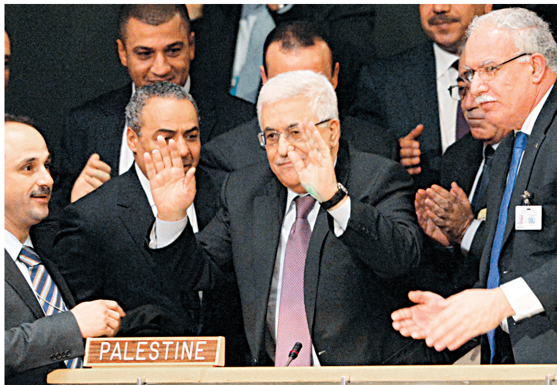
Mahmoud Abbas était content jeudi lors du dévoilement des résultats du vote. À Ramallah, c'est une éruption de joie qui a accueilli le vote de l'ONU.