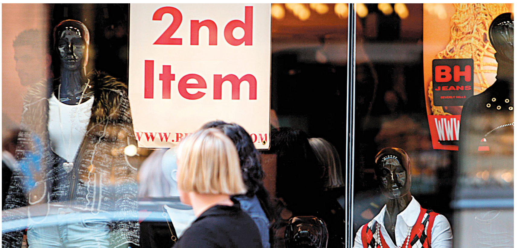
Au-delà de l'affichage, l'anglais est aussi bien présent dans les communications orales du monde du travail québécois, révélait cette semaine l'Office québécois de la langue française.

Dans les circonstances, la réaction calme du gouvernement Marois et de l'OQLF s'explique bien, dit le linguiste Jean-Claude Corbeil, l'un