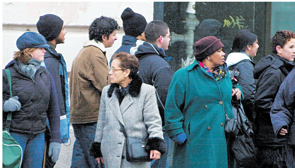
La rupture est vive entre la politique d'immigration et celle de l'intégration.