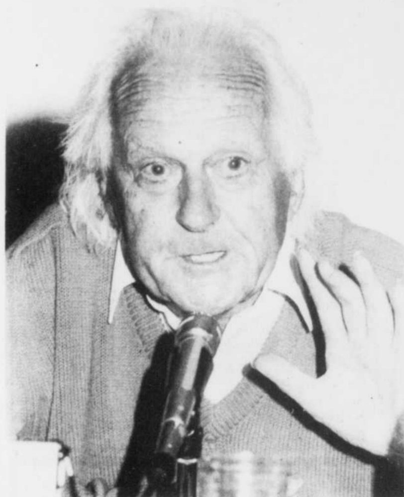
L'agronome René Dumont lors de la conférence qu'il prononçait à l'Université de Sherbrooke, en marge du Colloque international sur les relations entre les Etats et les coopératives.

Une autre connerie donnée en exemple. Ce stupide acharnement des riches à détruire les pissenlits, des plantes pourtant très riches en vitamine A, cette vitamine qui permettrait de réduire de moitié la