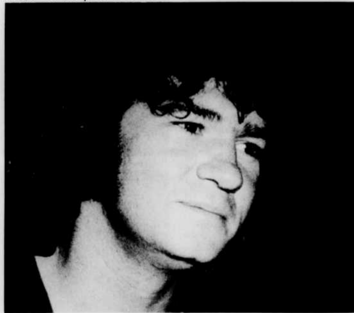
À soir on fait peur au monde

Festival du cinéma canadien mardi 25, 23 h 00