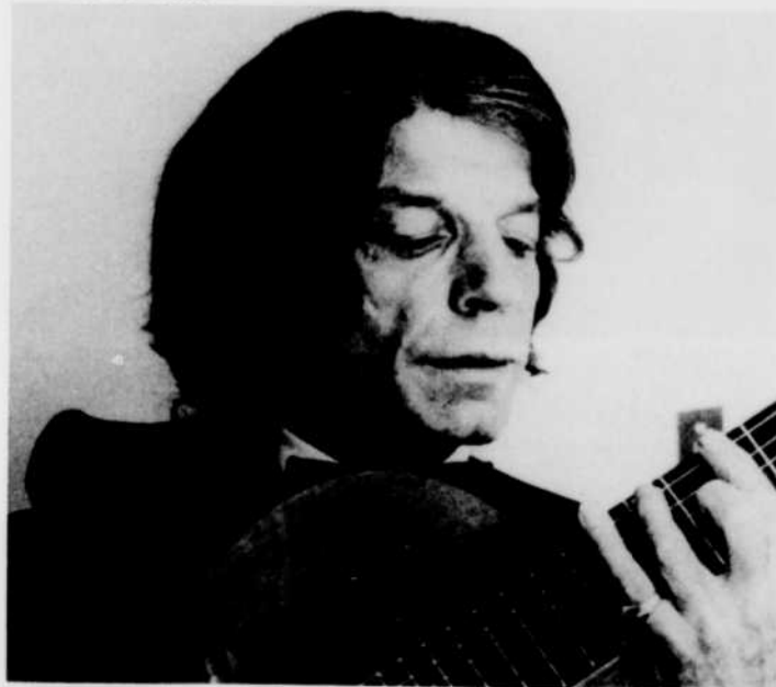
Manitas de Plata

Le film que nous verrons le 25 juin relate les débuts de sa prodigieuse carrière. François Reichenbach promène sa caméra dans le village gitan et nous montre des visages attachants de jeunes enfants et de vieillards. Ce court métrage dessine un portrait intime et véritable d'un artiste authentique qui possède une maîtrise innée de son instrument et dont la principale difficulté consiste à s'habituer aux avions et à perdre, en somme, sa liberté.