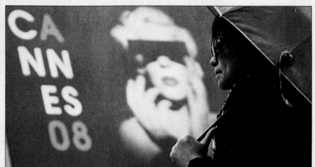
La pluie tombait sur Cannes, hier, où le 61 e festival de cinéma doit démarrer aujourd'hui.