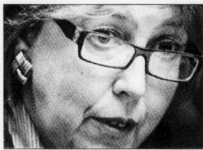
La chef du Parti vert du Canada, Elizabeth May