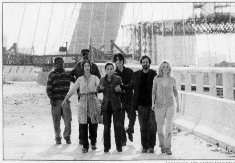
Une scène de Blindness , le film d'ouverture du 61 e Festival de Cannes, signé Fernando Meirelles.

Mais reprenons du départ. Blindness , le titre du suspense d'anticipation sur une «épidémie de cécité», avec Julianne Moore en dernière voyante, semble parfaitement trouvé pour inaugurer un programme cinéma dans lequel on avancera forcément à l'aveuglette. Certes, nous palperons chemin faisant les formes familières de Steven Soderbergh ( Che ), Wim Wenders ( Rendez-vous à Palermo ), Nuri Bilge Ceylan ( Les Trois Singes ), Jia Zhang Ke ( 24 City ) et des frères Dardenne ( Le Silence de Lorna ), ceux-là deux fois palmés dans le passé. Mais nous allons aussi, et c'est le beau risque de l'aventure, découvrir les films d'artistes en devenir, issus d'Israël, des Philippines, de Singapour, pour la première fois en compétition après que leurs opus précédents eurent éclairé les projecteurs d'«Un certain regard», volet officiel en parallèle à la compétition, de la Semaine de la cri-