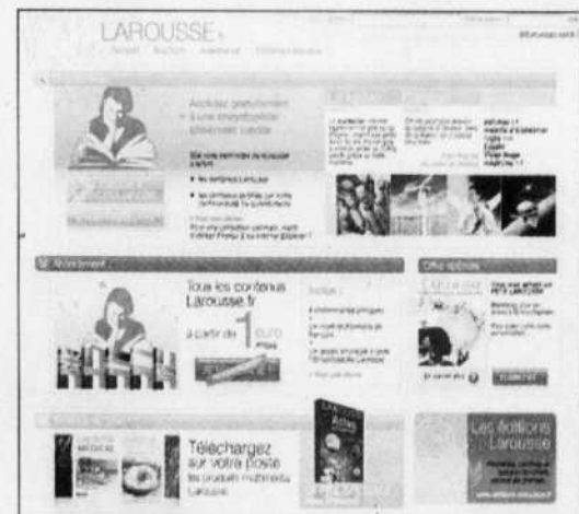
La page d'accueil de la version en ligne de l'encyclopédie Larousse lancée hier.