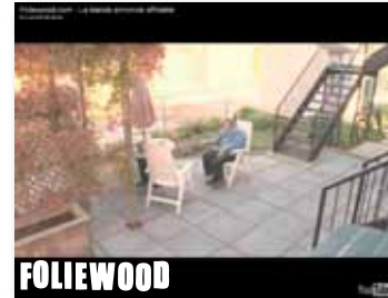
Bande-annonce de la web-série « Foliewood ».