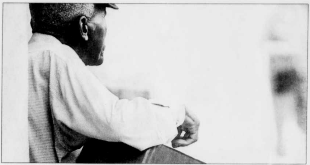
Dans les rues du quartier français, à n'importe quelle heure ou presque, vous croiserez des musiciens de rue partageant gratuitement leur talent.