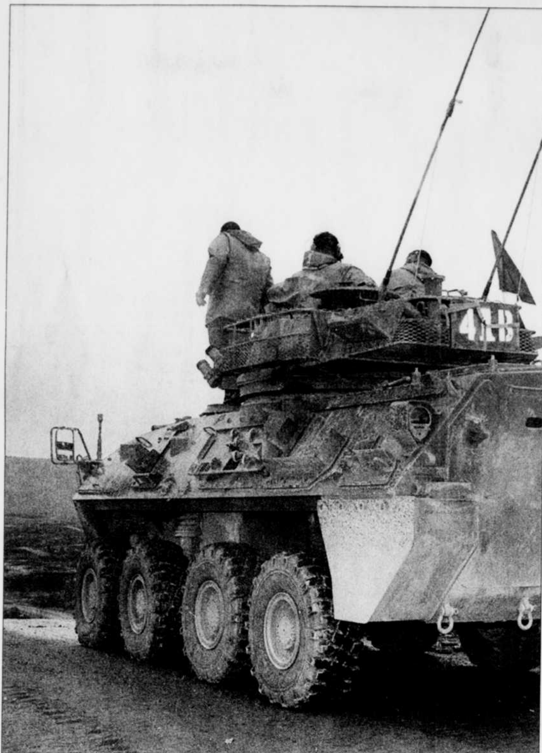
Pour 2000 $, le touriste fortuné peut faire une balade de 6,4 km en char d'assaut.