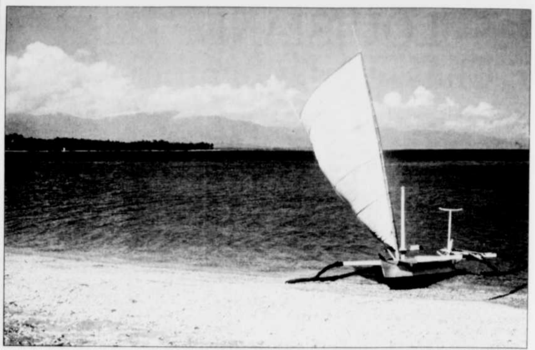
L'un des beaux côtés de Bali... ses plages!