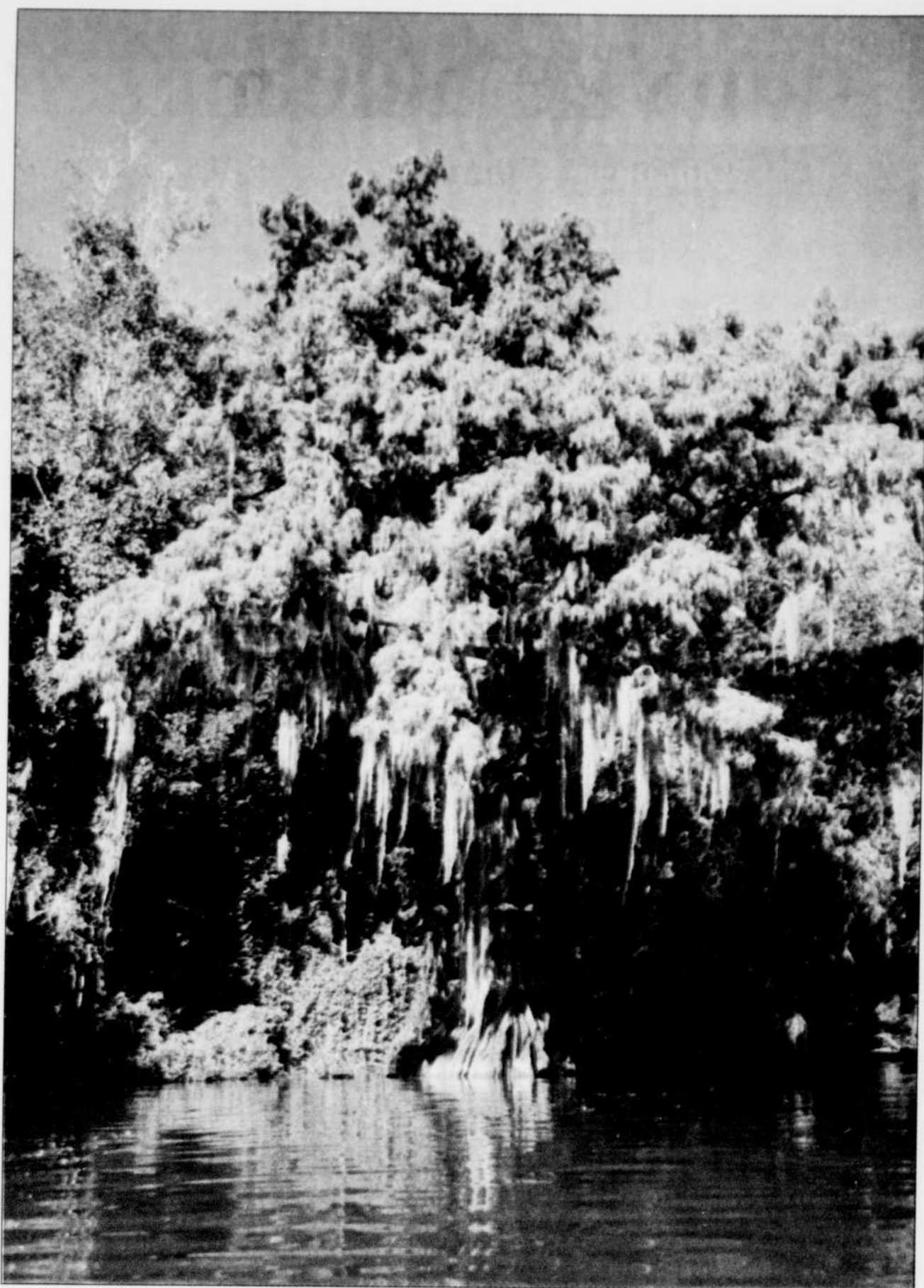
COLLABORATION SPÉCIALE: YVES OUELLET

Les restos cajun font penser à nos cabanes à sucre