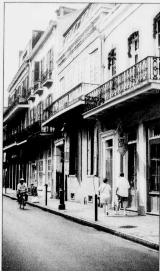
Le Vieux Carré français constitue l'âme de La Nouvelle-Orléans.