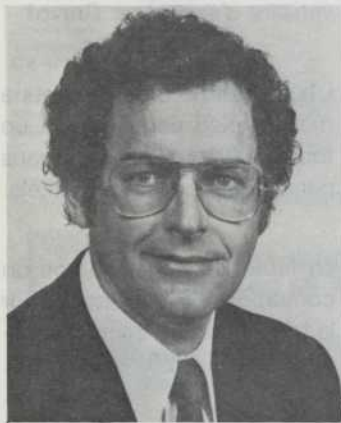
Conférencier invité: L'Honorable Francis Fox, Ministre des communications