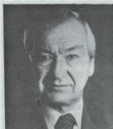
Mardi, 21 février M. Pierre Juneau Président de la Société Radio-Canada

Membre de la Société royale du Canada, officier de l'Ordre du Canada, membre des conseils d'administration du Centre national des Arts et de l'Office nationale du film, M. Juneau a débuté son mandat de président Photo à la Société Radio-Canada en août 1982. Mandat qui devra durer sept ans.