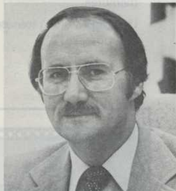
M. Guy Tardif Ministre de l'Habitation et de la Protection du Consommateur

Vous n'avez pas encore réservé votre table pour assister au gala de l'habitation 1984 qui se tiendra à l'hôtel Régence Hyatt, vendredi le 23 mars prochain à compter de 18h30! Qu'à cela ne tienne, vous pouvez toujours le faire en téléphonant dès maintenant à la Chambre (tél. : 866-2861). De cette façon vous pourrez prendre part à cette magnifique soirée, que tout le monde dans le domaine qualifie d'«événement de l'année» pour l'industrie de l'habitation.