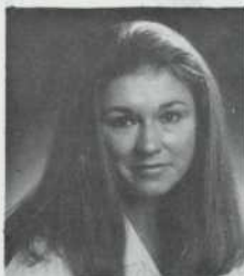
Mardi, 6 mars L'Honorable Céline Hervieux-Payette Ministre d'État à la Jeunesse