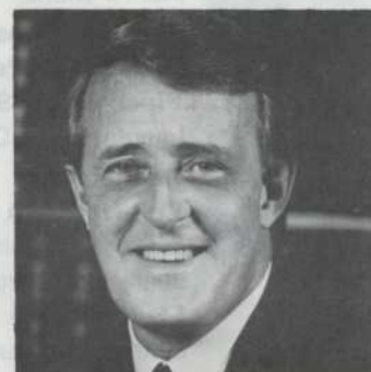
Brian Mulroney, Chef du parti conservateur