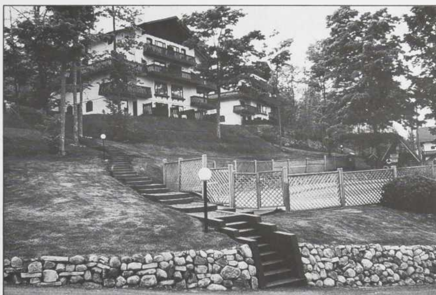
Le Tremblant Club, site du 22 e Congrès de la CBPQ.