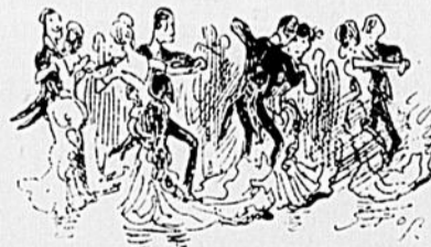
LE BAL CHEZ VERVAIS

Et puis le soir toute la noce a pris le tramway et s'est rendue à l'Hôtel Vervais où il y eut un bal qui restera mémorable dans les fastes du chemin du Sault.