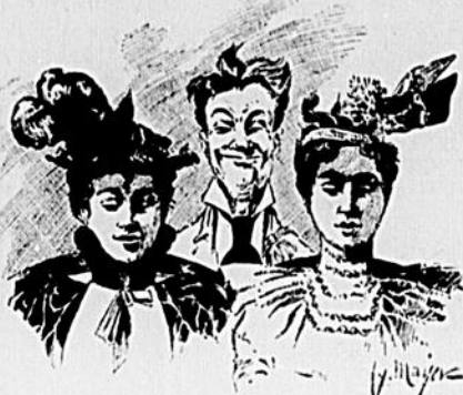
II Merci !