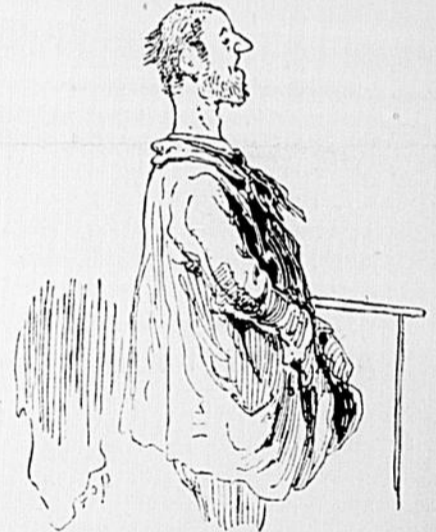
PORTHOS DEVANT LE RECORDER.

Atroce a pris le "Gold Cure" et est devenu membre de la Société de Tempérance de la paroisse du Sacré-Coeur.