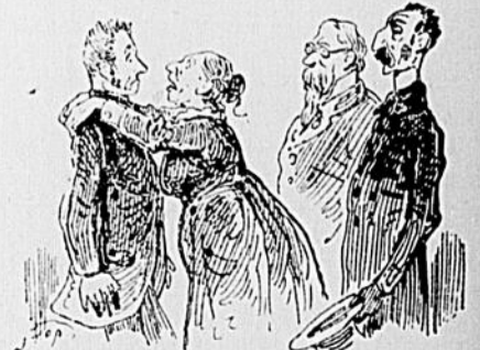
LE SERMENT DE BISTOQUET

Bistoquet a fait serment en présence de deux de ses amis de ne plus lever le coude pendant le restant de ses jours.