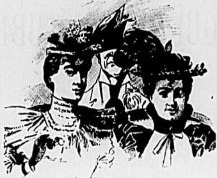
I UN MONSIEUR DE L'ORCHESTRE.—Si ces dames étaient assez bonnes pour changer de sièges.