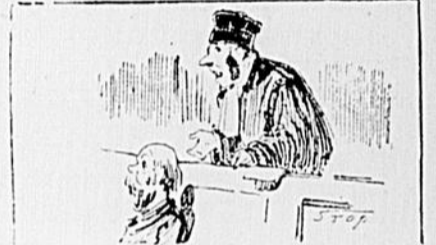
BONNACIEUX EN COUR

Son mari le jour où il est sorti de prison, a récidivé. Il a paru devant la cour du Banc de la Reine sous la prévention d'avoir refusé à sa femme les choses nécessaires à la vie. Grâce à l'éloquent plaidoirie de son avocat,