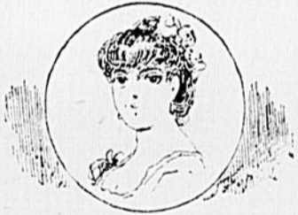
LE PORTRAIT DANS LE MÉDAILLON

Le mariage de notre héros avec la belle Cordélie avait été décidé le lendemain de l'entrevue de cette dernière avec la Milady Mordante. Celle-ci après avoir reconnu le portrait renfermé dans le médaillon de la jeune choriste de l'opéra, lui demanda d'une voix entrelardée de sanglots.