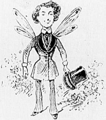
D'ARTAGNAN LE JOUR DES NOCES

D'Artagnan était beau à voir. Il paraissait heureux comme un papillon bleu.