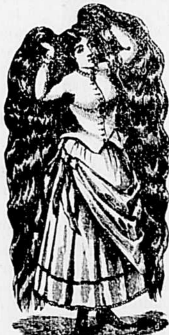
MARQUE DE COMMERCE.

Robson rend aux cheveux leur noir primitif, mais il possède de plus la précieuse propriété de les assouplir et de leur donner un lustre incomparable. Essayez ce Restaurateur, et vous serez pleinement satisfait. Prix 50 cts la bouteille. Vendu chez tous les marchands et chez L. ROBITAILLE, Pharm, Joliette.