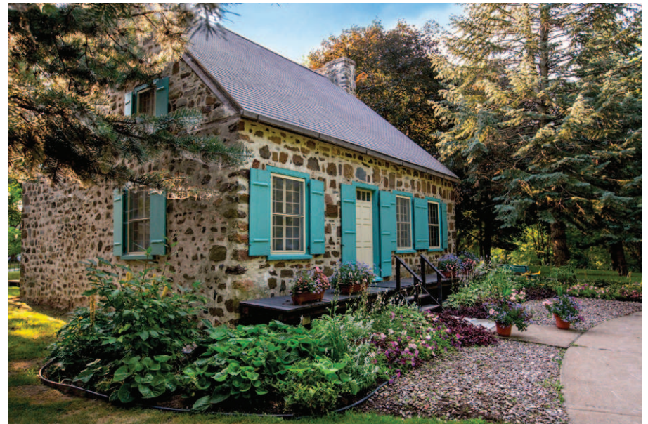
La maison d'esprit français est classée monument historique.

présente les différentes actions de Louis-Hippolyte La Fontaine.