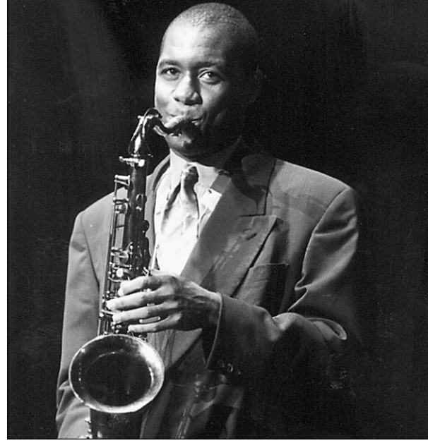
Branford Marsalis

En ouverture, Dave Brubeck Quartet et son oratorio To Hope; UZEB en clôture. On se souviendra de Branford Marsalis, du Ed Blackwell Project, de Four pianos for Phineas, Davis Sanborn, Salif Keita, Steve Lacy, Alain Caron/Michel Donato, des chanteuses Holy Cole et Liane Foly, de l'organiste Barbara Dennerlein. Soir après soir, la série gitane électrise la foule : Stochelo Rosenberg, Bratsch, Strunz & Farah.