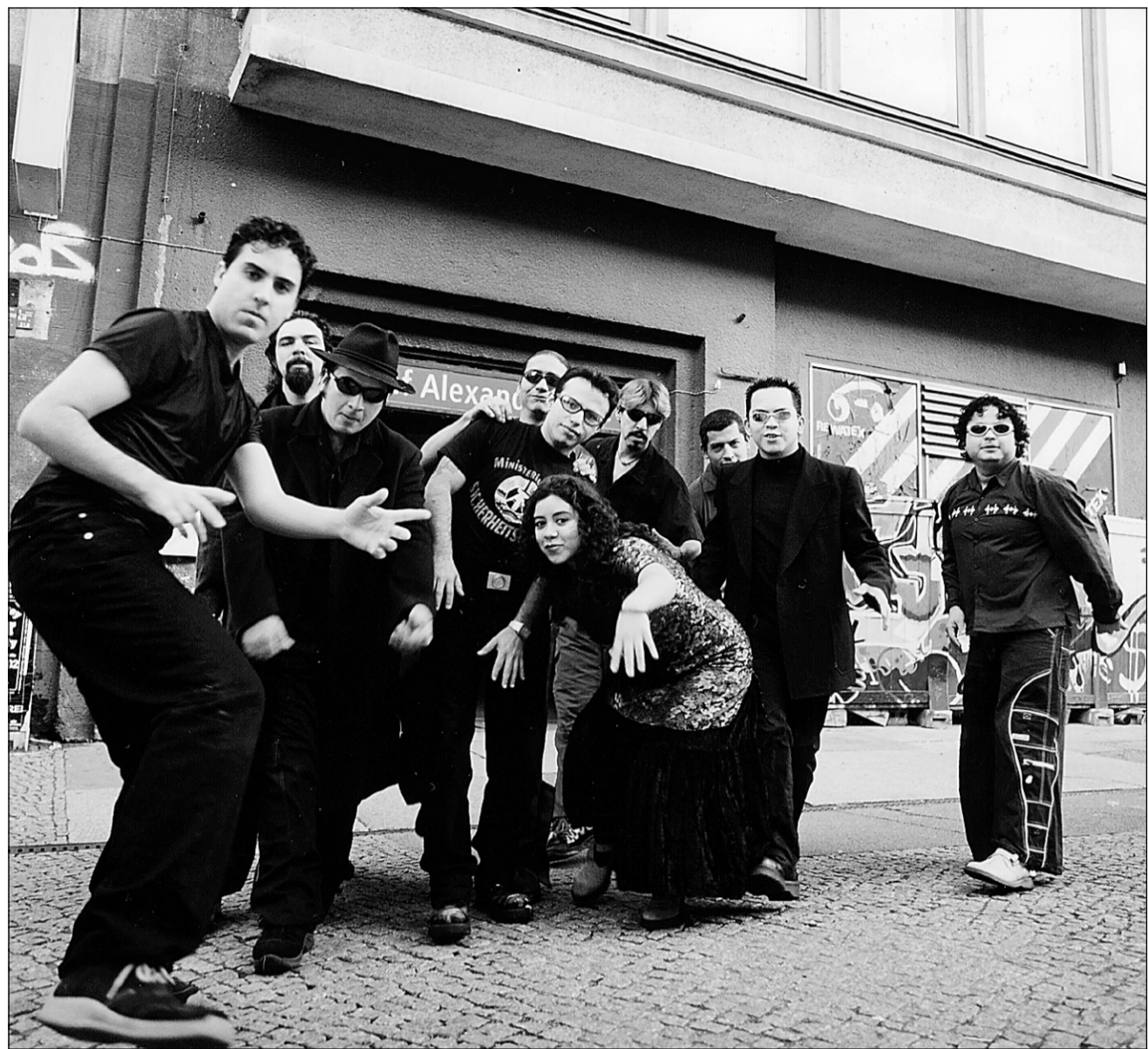
Issu des rues de Mexico, Los de Abajo (littéralement : « ceux d'en bas ») s'est formé il y a plus d'une décennie, en 1992.

Los de Abajo se produit ce soir, 19h30, sur la scène Bleue Légère.