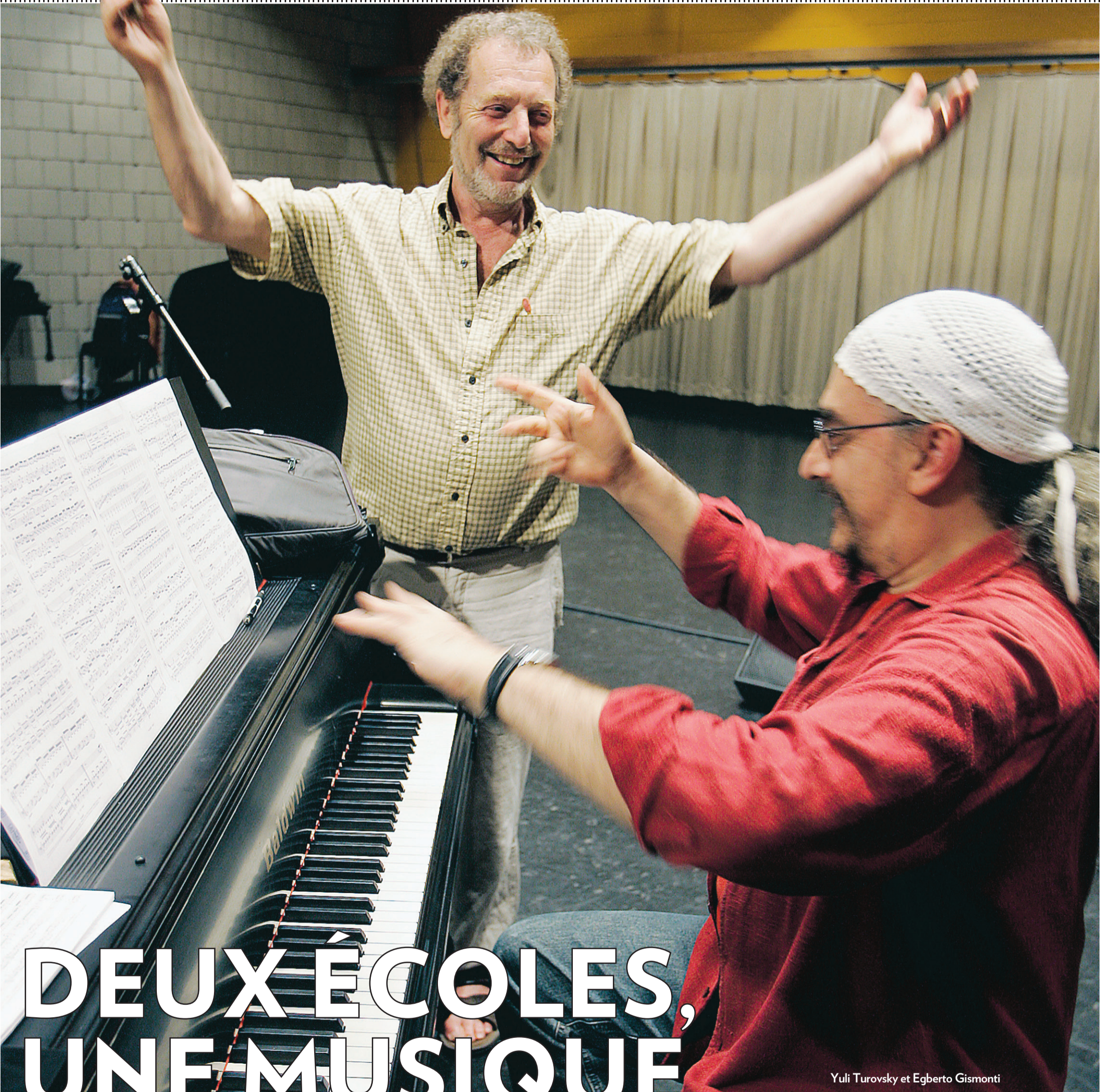
Yuli Turovsky et Egberto Gismonti