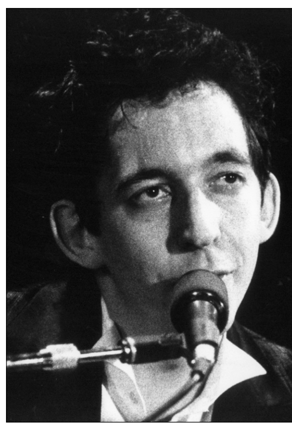
Arthur H