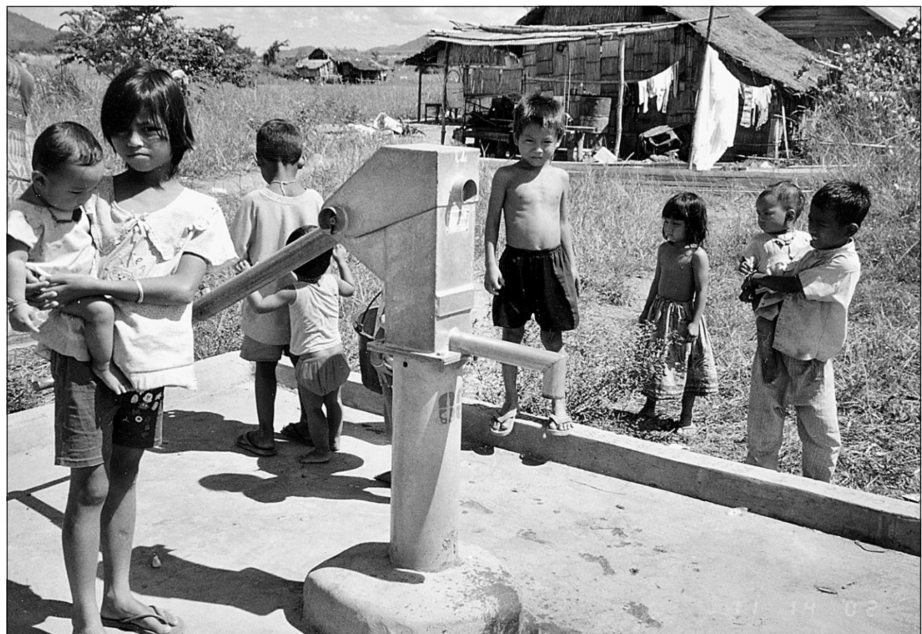
L’installation de puits pour remplacer les mares d’eau contaminées où s’abreuvent les habitants de villages éloignés des grands centres urbains (au Cambodge et au Laos), constitue la première amélioration apportée au sort de ces populations par une organisation québécoise qui construit également des écoles et des cliniques pour ces populations démunies. Renseignements : Association des droits de l’enfance en difficulté et dans la souffrance (ADEDS), www.adeds.org , tél. 514-355-6395.