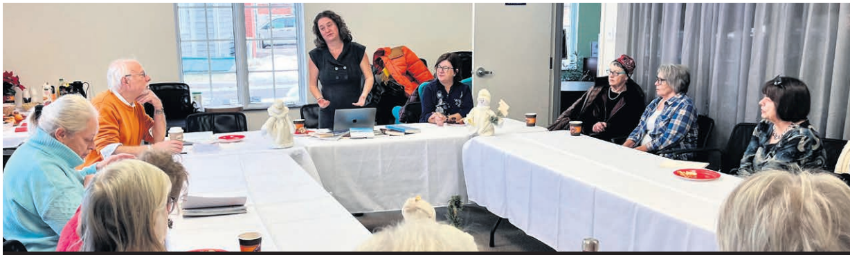
Des fonds de 55 000$ sont octroyés pour soutenir les projets visant à soutenir la richesse culturelle et patrimoniale du territoire de la MRC de D'Autray.