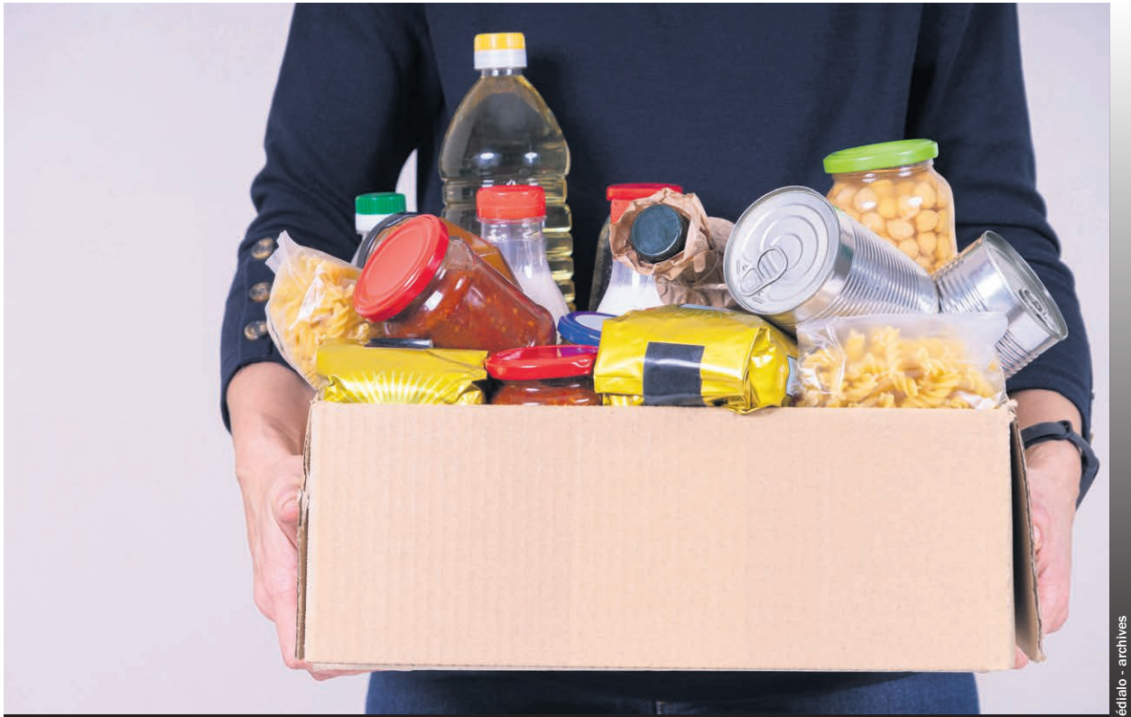
Grâce à son travail de transformation et de distribution d'aliments, le projet Nourrir Lanaudière a pu apporter son aide à des milliers de familles lanaudoises.

La TPDSL souhaite remercier la trentaine de partenaires issus de la région qui sont impliqués dans le projet. Elle espère d'ailleurs que d'autres partenaires s'ajoutent à ce nombre pour favoriser la continuité, la logistique et la pérennité de Nourrir Lanaudière. (JJ)