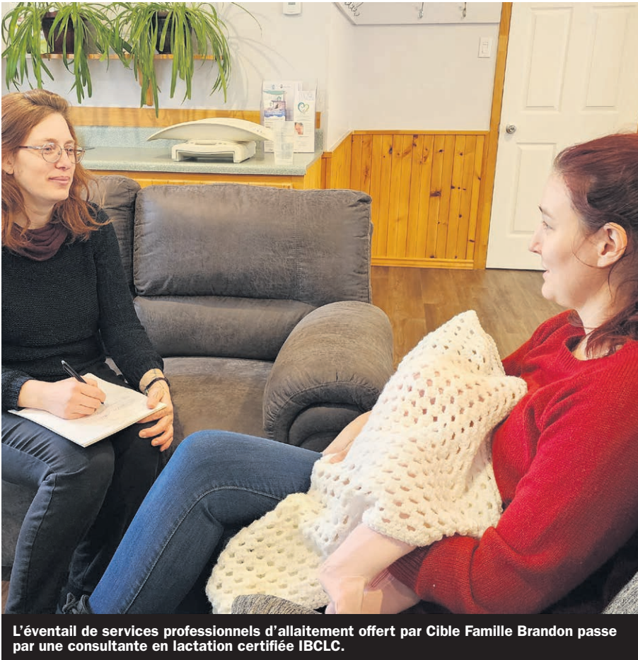
L'éventail de services professionnels d'allaitement offert par Cible Famille Brandon passe par une consultante en lactation certifiée IBCLC.