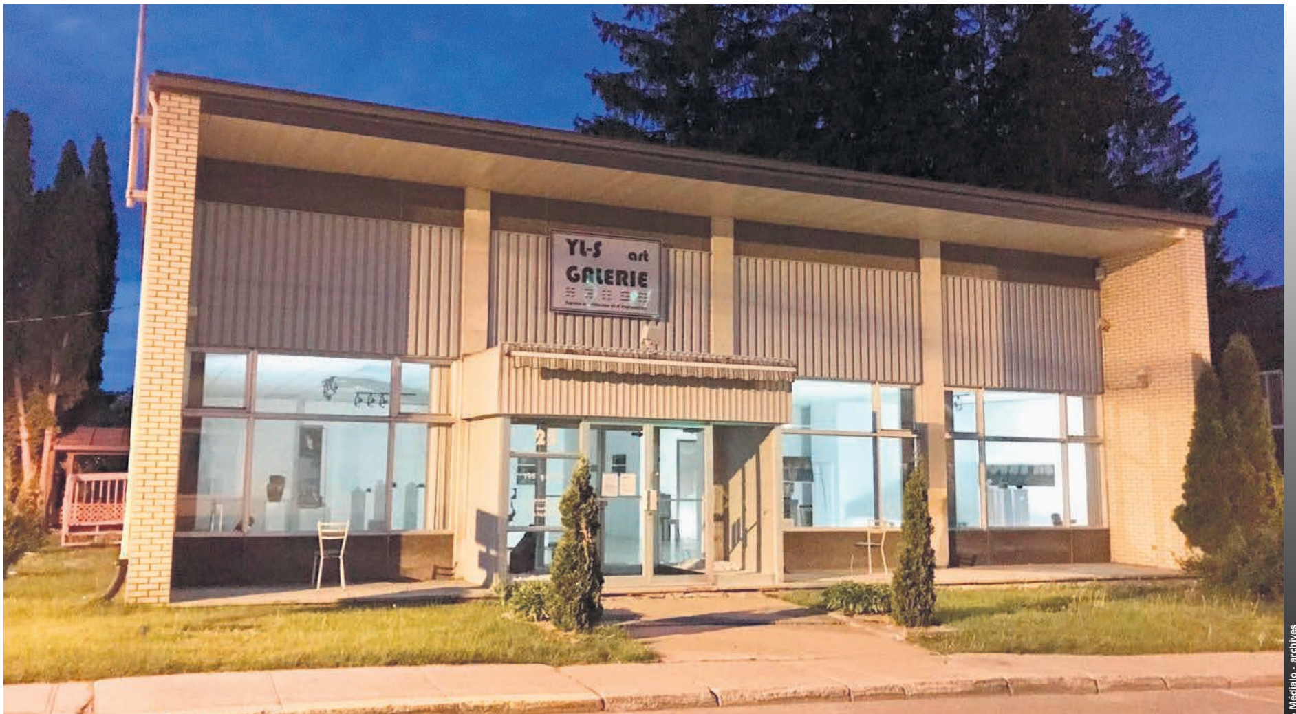
La Galerie YL-S est située à Ville Saint-Gabriel.