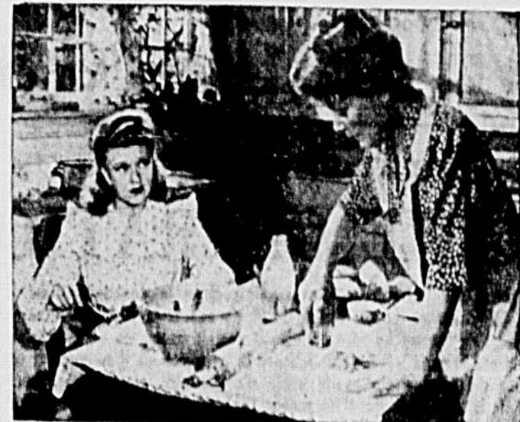
Ginger ROGERS et Spring BYINGTON dans une scène du film "I'll Be Seeing You", à l'Ecran du Loew's.

A l'occasion de l'anniversaire de la mort de Chateaubriand, le 4 juillet 1844.