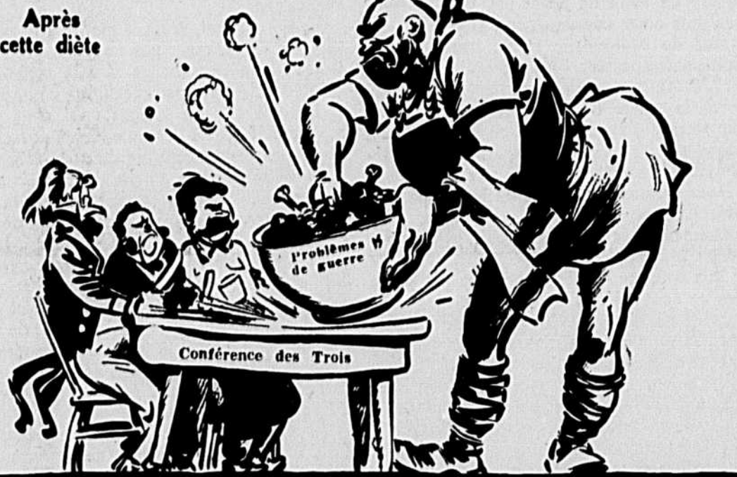
Après cette diète