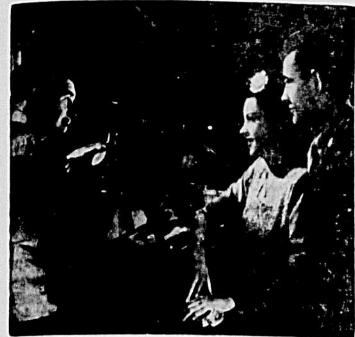
James GLEASON, Judy GARLAND et Robert WALKER dans "The Clock", qui prend l'affiche au Capitol.