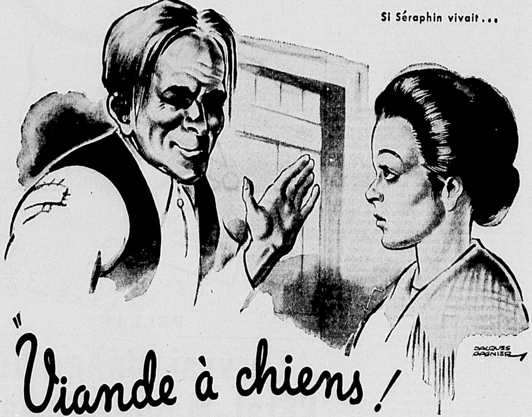
Si Séraphin vivait...