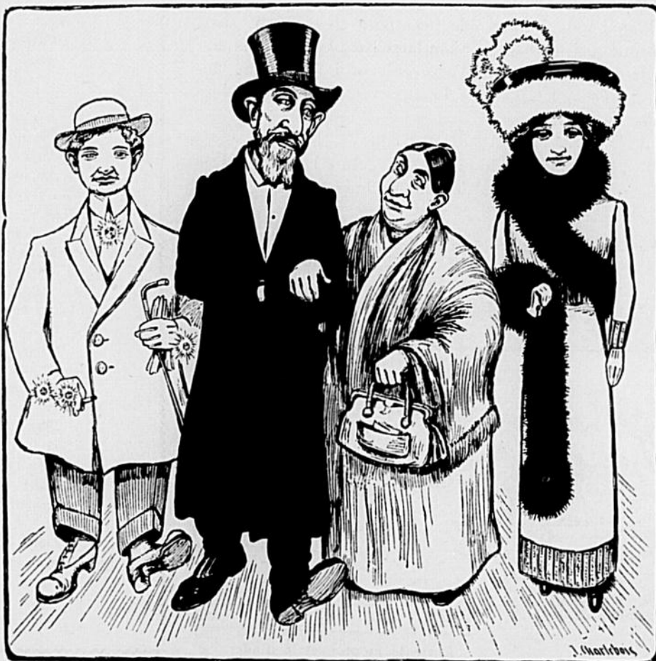
Médéric, par Charlebois.