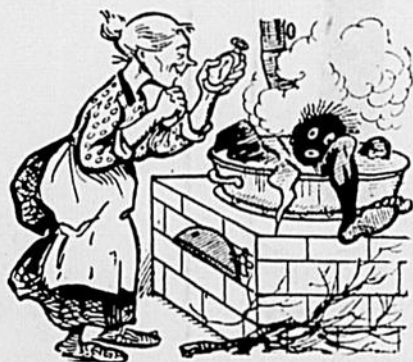
—Mon Dieu, j'm'suis trompé d'viandel

Plus ému qu'elle, il s'approcha avec précaution, comme s'il al-