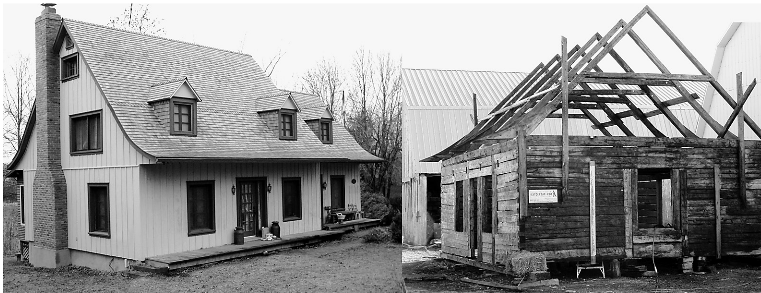
Redonner vie à l'ancien: le credo de Maisons traditionnelles des Patriotes.

«La toiture est arrondie et le plafond cathédrale est arrondi. Il y a beaucoup de fenestration à l'avant. C'est un style beaucoup plus contemporain. Ce sont les nouvelles tendances et les