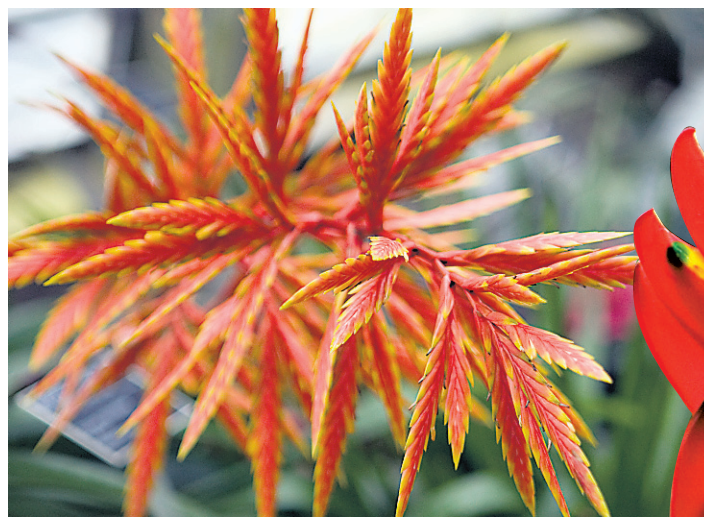
Certains vrieseas ont une taille considérable et donnent une floraison spectaculaire. La hampe florale de ce spécimen de la collection du Jardin botanique de Montréal ( Vriesea zamorensis ) atteint près d'une cinquantaine de centimètres.

Nommés en l'honneur de Willen Hendrik De Vriese, professeur de botanique à Amsterdam au début des années 1800, les vrieseas sont aussi des plantes épiphytes, très semblables aux tillandsias, de même origine, mais aux feuilles beaucoup plus larges, souvent très colorées ou marbrées. Leur floraison s'étale sur quatre à cinq semaines. Cette plante est plus spectaculaire encore avec une hampe florale et des fleurs dans des tons de jaune, d'orange ou de rouge. On les retrouve aussi dans les grandes surfaces. Ses exigences culturales sont identiques à celle des tillandsias. Les feuilles sont aussi en grande partie responsables de l'absorption des nutriments, les petites racines n'absorbant que 10 à 15% de l'eau de la plante. Une fois la floraison terminée, il est conseillé d'attendre que les drageons atteignent le tiers de la hauteur de la plante mère avant de couper la hampe florale qui termine sa vie active. On pourra alors, au besoin, transplanter ces rejetons dans un nouveau pot.