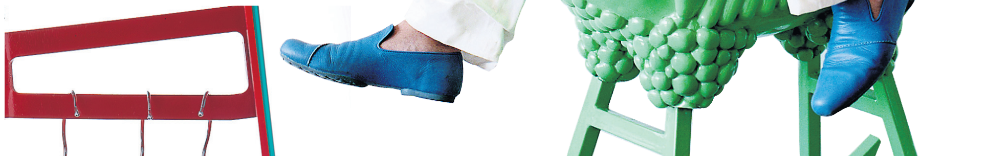
La grande vedette invitée au salon IDS était Jaime Hayón, artiste et designer espagnol à l'esprit très créatif. On le voit sur son poulet à bascule Green Chicken.

Un dossier de Lucie Lavigne en pages 2 à 5.