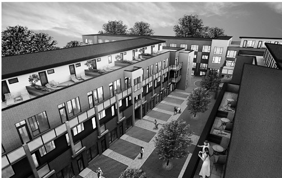
Le complexe Parc Saint-Victor comprendra trois immeubles de quatre étages, dotés de stationnements intérieurs et reliés par un corridor souterrain. Les édifices seront ainsi entourés de verdure et une cour intérieure sera aménagée.

Parc Saint-Victor, qui se dressera à l'intersection de la