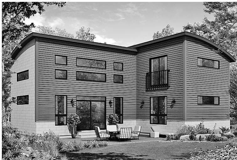
La maison Bauhaus est isolée avec une mousse isolante ultra-performante. Le revêtement extérieur est de bois et fibrociment.