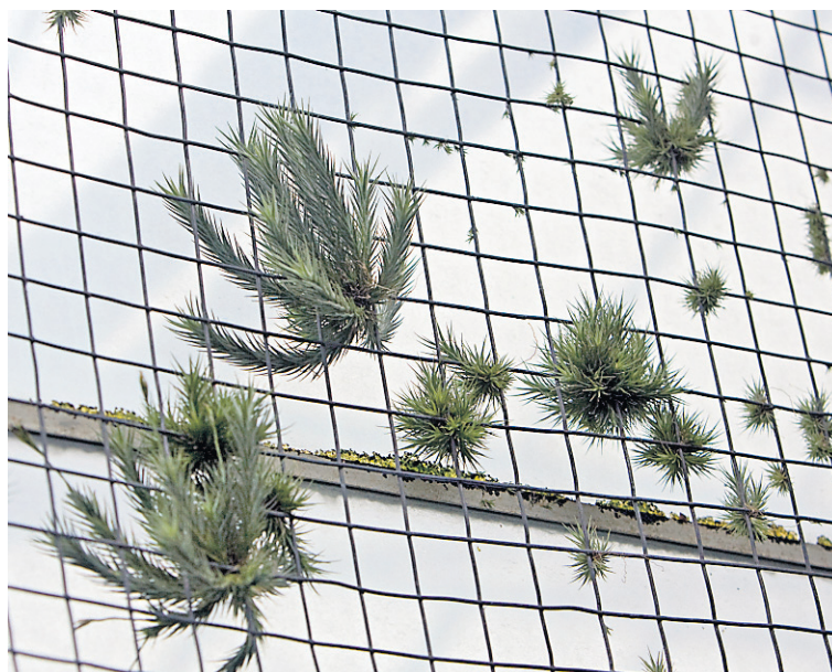
Les plantes d'air peuvent pousser partout. Dans le Sud, on les découvre souvent sur les fils électriques. Au Jardin botanique, elles colonisent parfois les treillis métalliques.

Moins populaires qu'elles ne l'étaient jadis, ces plantes d'air sont souvent vendues collées sur une pierre ou sur un bout d'écorce, habituellement de chêne-liège. Elles exigent une lumière vive mais sans soleil direct et, bien entretenues, elles peuvent parfois donner des fleurs bleues. Plus délicat qu'il n'y paraît, ce type de tillandsia succombe habituellement à des arrosages trop