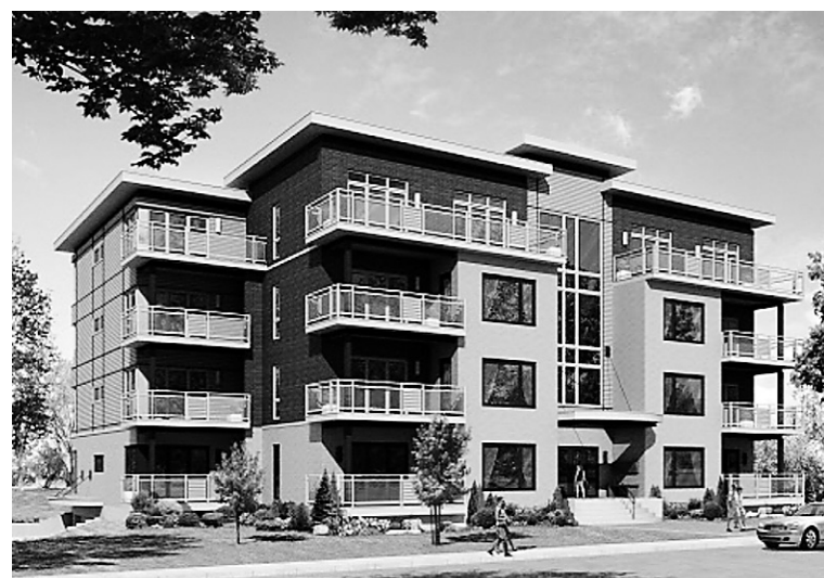
ILLUSTRATION FOURNIE PAR LES INDUSTRIES BONNEVILLE Le complexe Azure, à Belœil, comprendra à terme cinq édifices de quatre étages. Chacun d'entre eux comptera 24 appartements en copropriété d'une superficie variant entre 1200 et 1400 pieds carrés.