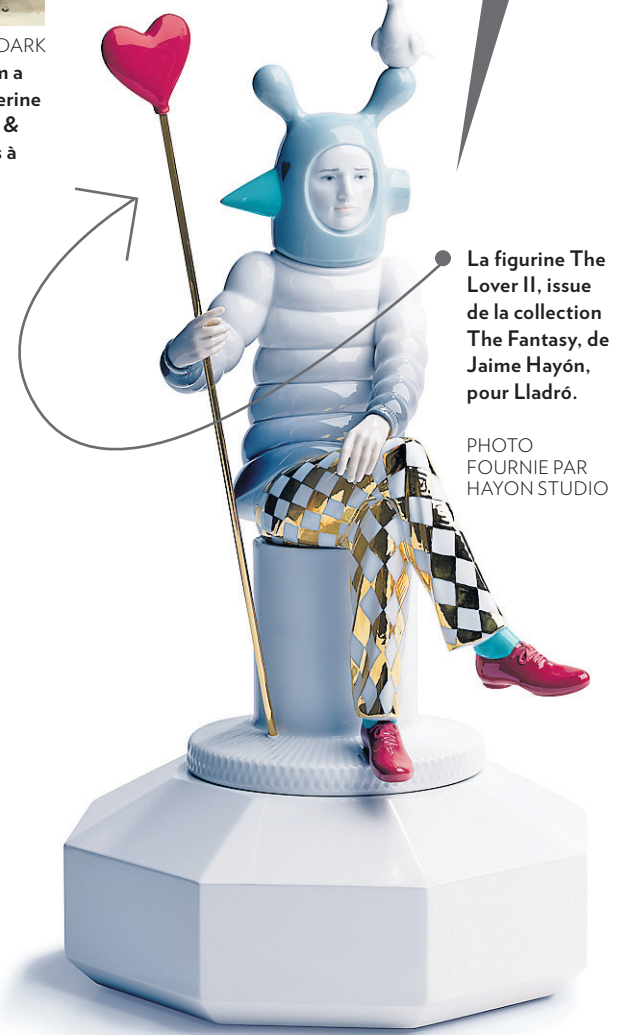
La figurine The Lover II, issue de la collection The Fantasy, de Jaime Hayón, pour Lladro.

Ce stand du salon IDS a été aménagé par les dirigeants de Smash, une boutique torontoise spécialisée dans la conception de meubles et d'installations réalisés à partir de matériaux usagés ou récupérés d'anciens édifices. On peut apercevoir comment ils ont réutilisé de vieux tiroirs pour créer une bibliothèque.