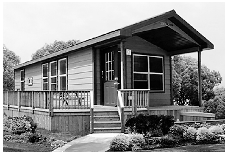
Un chalet de type cabine de General Coach Canada.