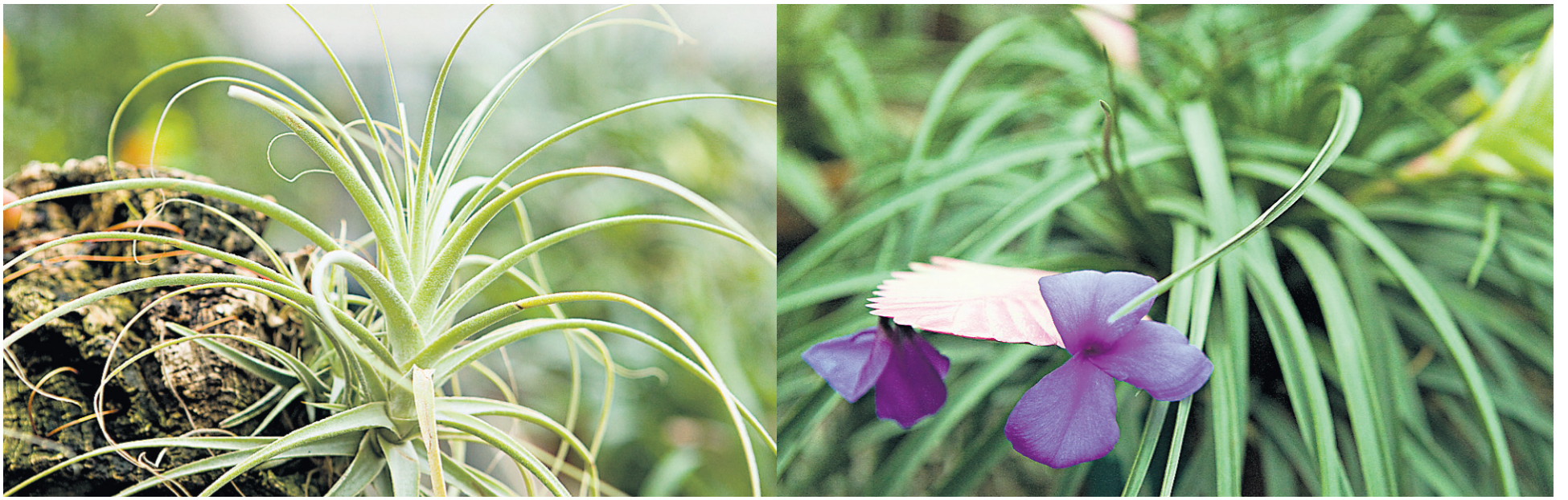
Le Tillandsia concolor est typique des plantes appelées « filles d'air » ou air plant en anglais.