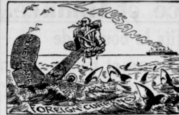
Nous n'avons rien à craindre de ce bateau; il a assez de lui-même à sauvegarder

Mais mon travail était vain! Mon sens professionnel m'avait dit cela au premier coup d'oeil. Pour en être doublement sûr je penchai ma tête sur sa poitrine et retins ma respiration, tout en écoutant si son cœur battait. Aucun battement ne me parvint. Burke avait payé le prix d'avoir voulu braver Fu Manchi. Il était mort!