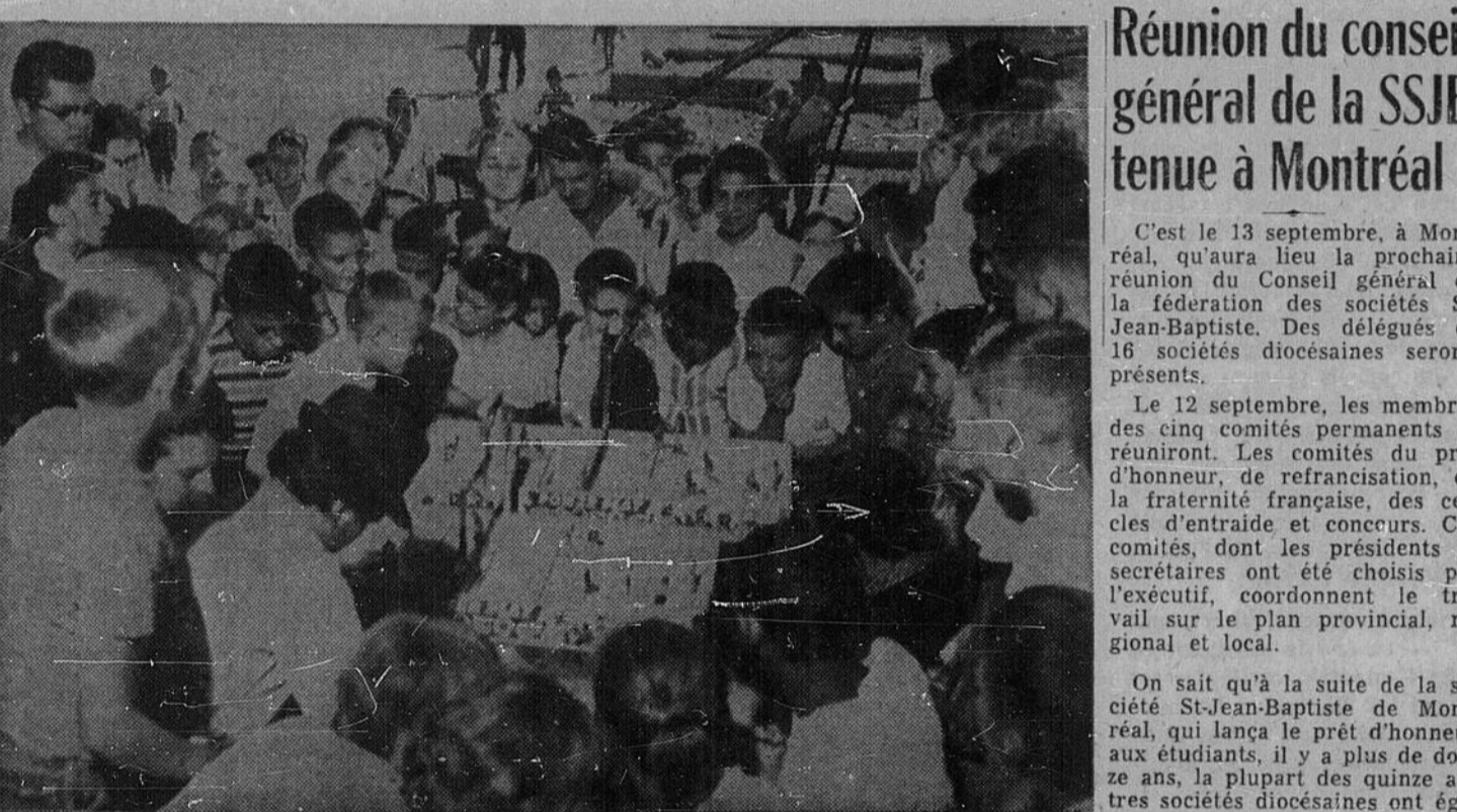
ON JOUE AU HOCKEY A ST-REDEMPTEUR — Fervents du hockey et des étoiles comme Maurice Richard, Jean Béliveau et autres, les jeunes du terrain de jeux St-Rédempteur de Hull se livrent à plusieurs jeux, mais parmi les plus populaires est celui du hockey sur table. On voit plusieurs jeunes, accompagnés de leurs moniteurs, surveillant une joute chaude-