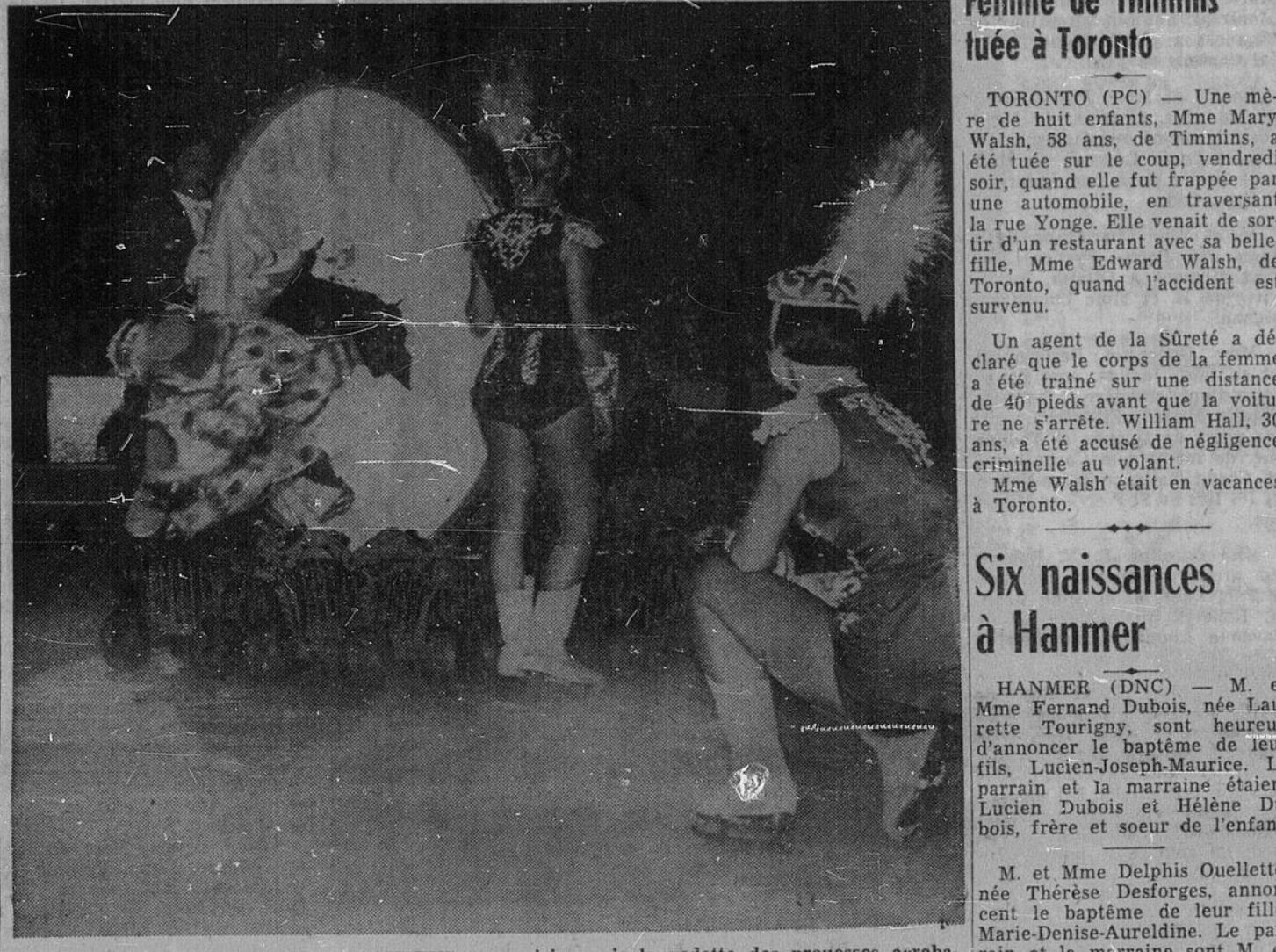
UN NAIN SAUTEUR OU UN SAUTEUR NAIN — Les Ice Capades 1959, qui ont été applaudis à l'Aréna de Sudbury, comprennent un peu de tout, mais le sauteur nain que voici a pris la vedette des prouesses acrobatiques. Nous le voyons ici qui saute à travers un écran de papier au dessus d'une dizaine de barils.