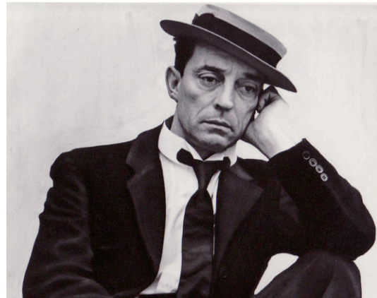
Souriez, vous êtes filmé...

KEATON, Buster & Charles SAMUELS, La Mécanique du rire. Autobiographie d'un génie comique , Nantes, Capricci éditeur, (Première collection), 2014, 324 pages.