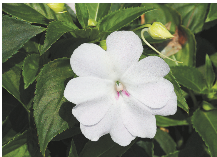
Impatiens Big Bounce