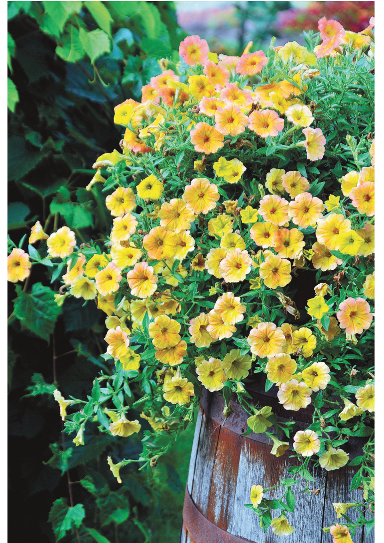
Pétunia Cascadias Indian Summer