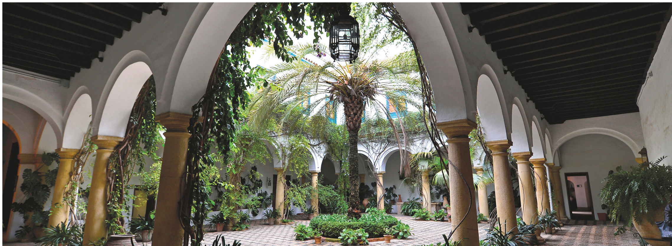
L'un des 12 patios du Viana Palace à Cordoue, en Espagne.

Du comté de Clare, qui comporte beaucoup d'attraits en Irlande, on peut descendre jusqu'à celui de Cork. Quant à Dublin, ça reste une ville très propice à la musique et aux pubs. D'ailleurs, ces derniers sont d'excellents endroits pour manger de délicieux mets locaux.