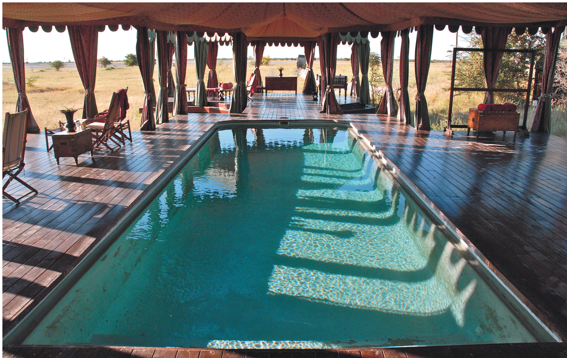
La piscine du Jack's Camp.