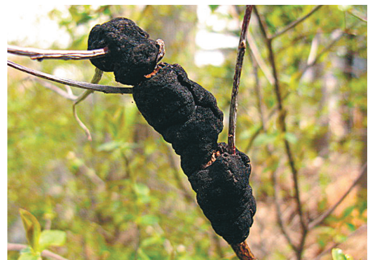
« Que peut-on faire si notre Prunus est infecté du nodule noir? »