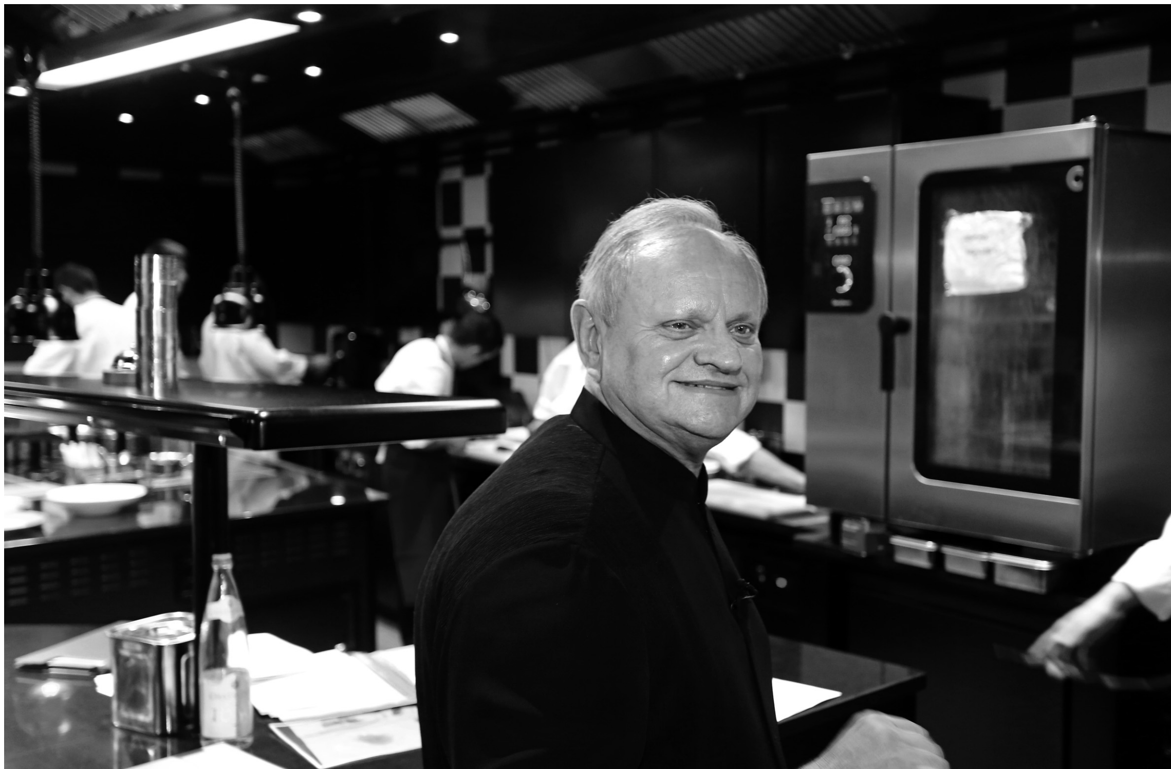
NICOLAS TUCAT AGENCE FRANCE-PRESSE

Les épicuriens, les critiques de restaurants et les grands voyageurs vous le diront, plusieurs facteurs contribuent à la notoriété d'un établissement: la cuisine, le service, le lieu, le décor, l'environnement et, finalement, les prix. L'ensemble doit procurer au visiteur un immense plaisir, une fête du goût qui donne envie d'y revenir.