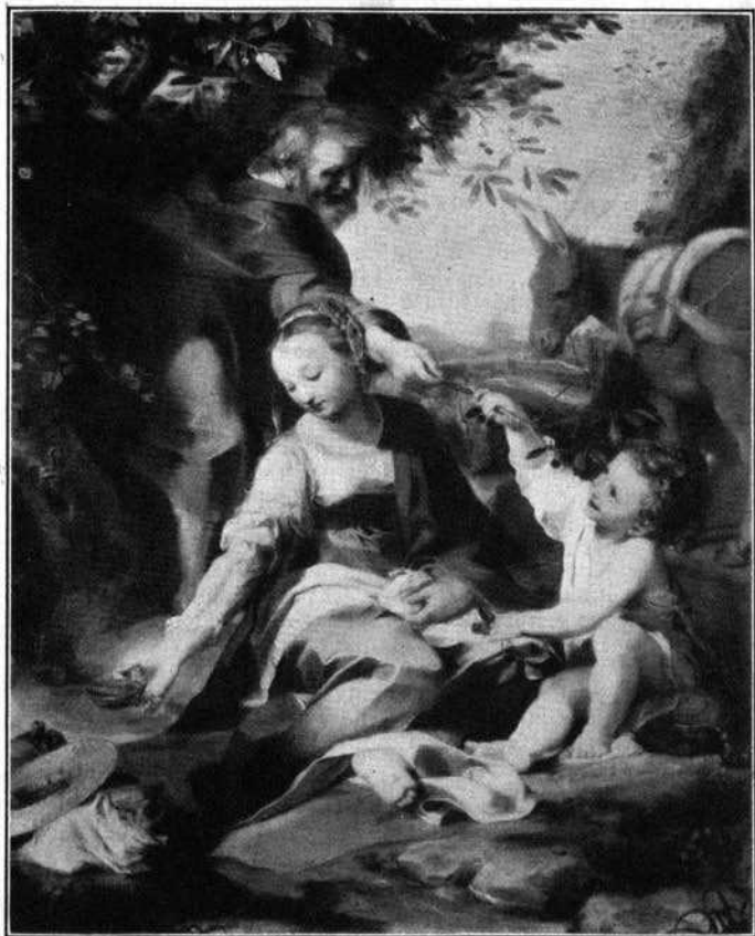
Musée du Vatican