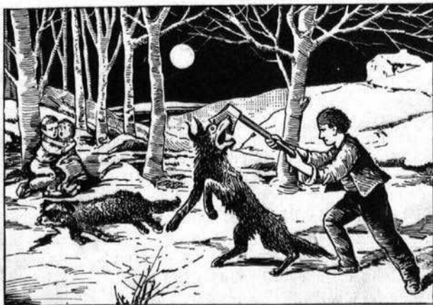
Etude sur la gravure

Charles NODIER (1780-1844), littérateur français, né à Besançon. C'est un conteur charmant.