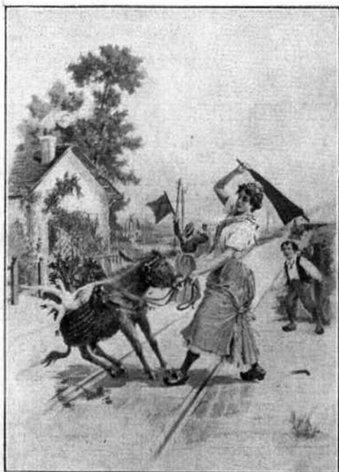
Pour empêcher l'incident de devenir un accident.