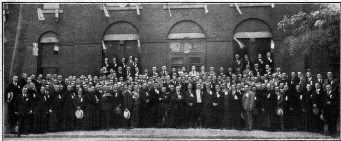
PREMIER CONVENTUM DES ANCIENS ÉLÈVES DE L'ÉCOLE SAINT-JEAN-BERCHMANS (MONTRÉAL)