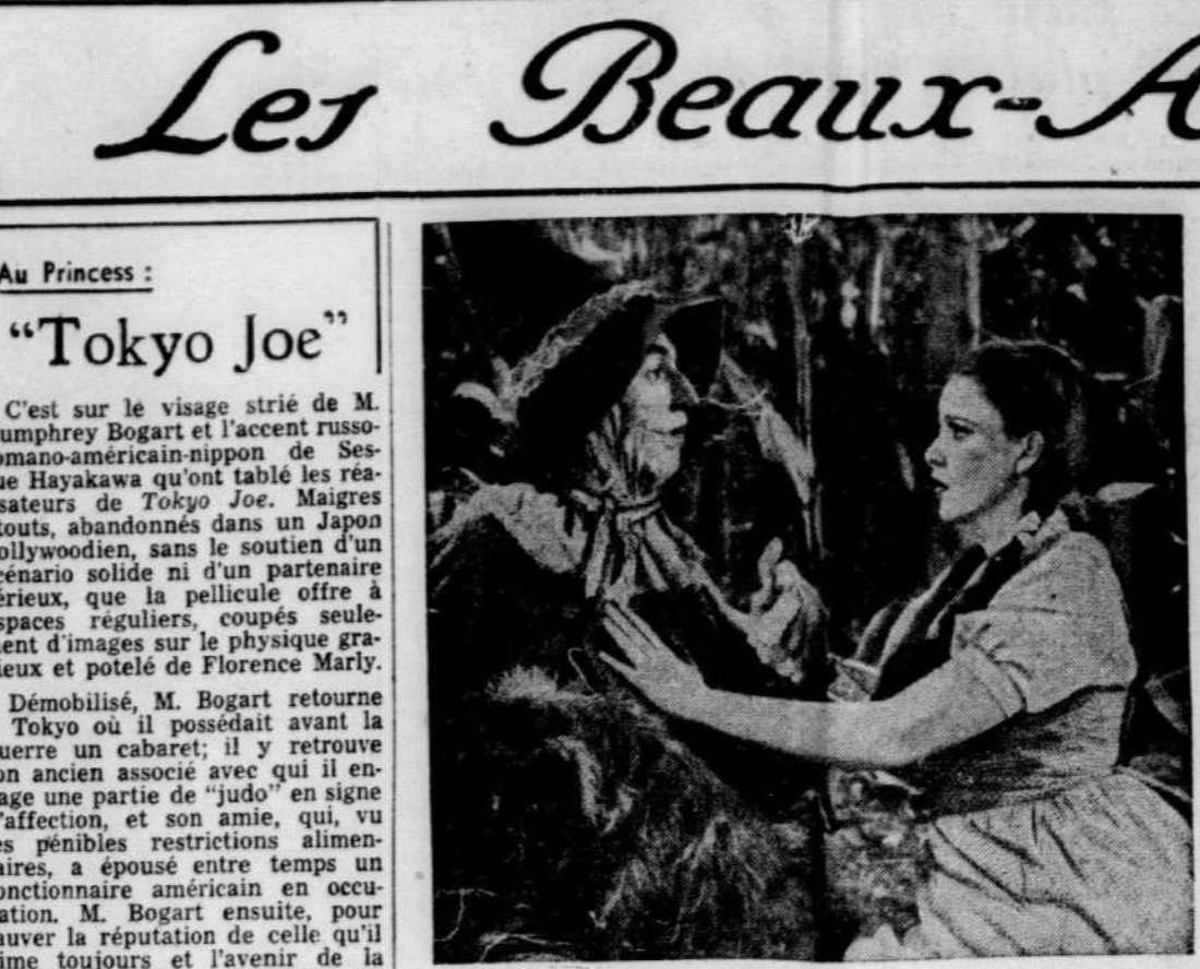
PAR EXCEPTION le film "Wizard of Oz" sera permis aux enfants accompagnés de leurs parents. Judy Garland y tient le rôle principal cette semaine sur l'écran du Capitole.

Cette magnifique manifestation, la première du genre qui soit officiellement offerte par des musiciens pour honorer la mémoire de Calixa Lavallée, est une chose insitée, qu'il convient de mentionner. Montréal est en droit d'être fier de pareille initiative de fierté nationale canadienne.