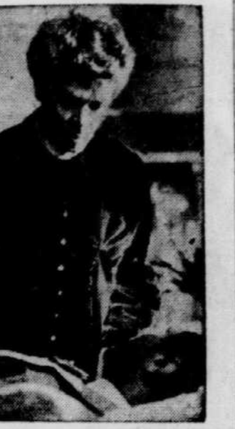
Au Princess: "Tokyo Joe"

Un bon sentiment avait traversé l'esprit de Pierre. Il pensait qu'il pourrait tout de même racheter son crime. Peut-être Samolovènerait-il chez son père le jeune Slavénarévitch devenu Turc —