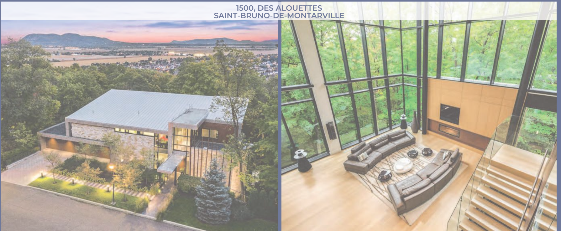
1500, DES ALOUETTES SAINT-BRUNO-DE-MONTARVILLE