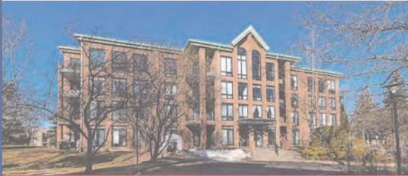
280, BOUL. SEIGNEURIAL O., APP. 404 SAINT-BRUNO-DE-MONTARVILLE