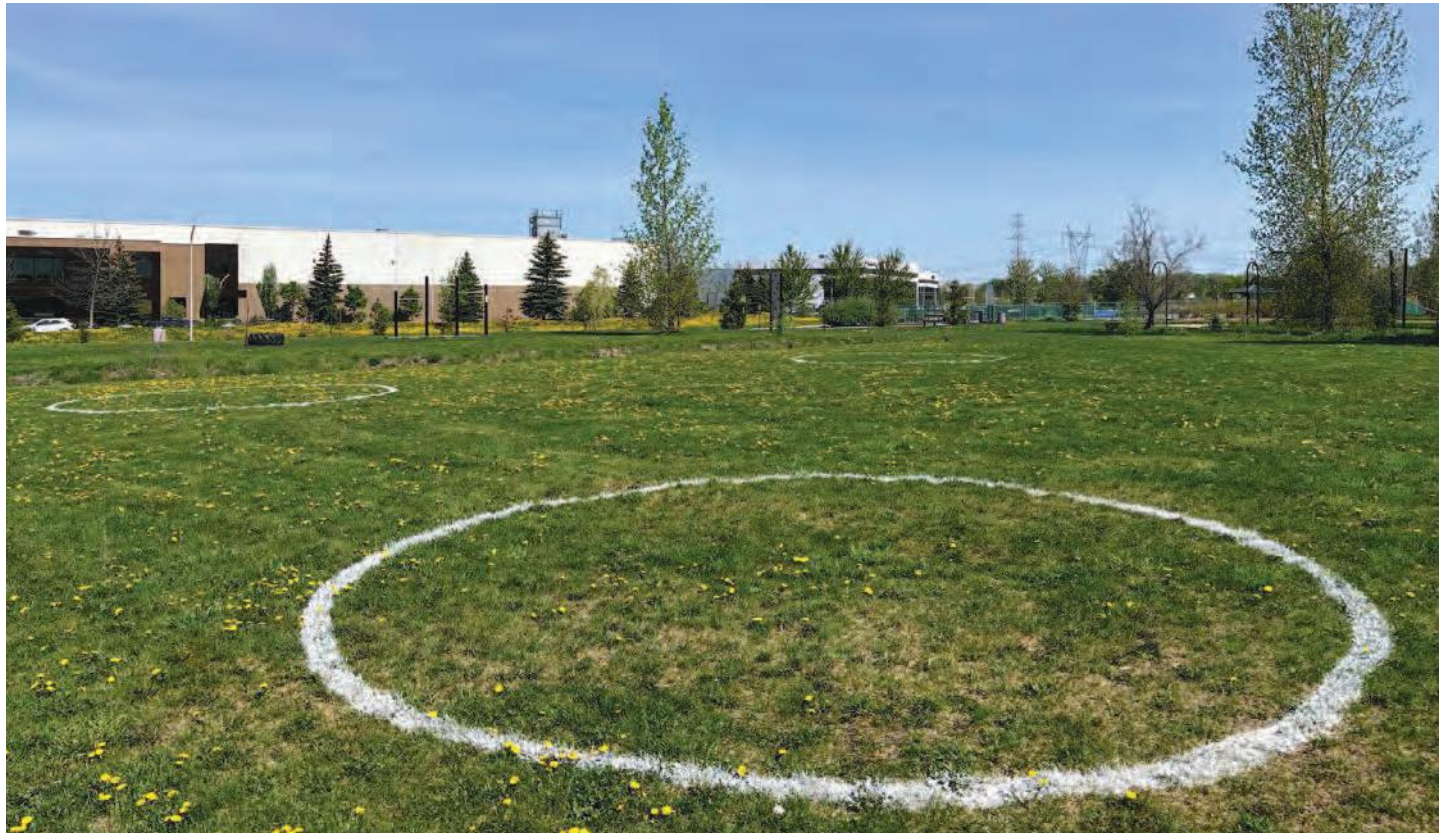
Ce sont quatre terrains en forme de cercle que la Ville de Saint-Bruno a aménagés au parc Marie-Victorin, tout près de la piste de BMX.