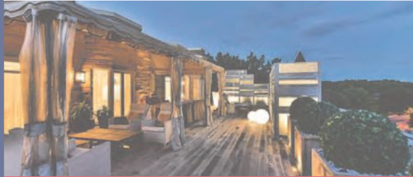
270, DE VIMY, APP. 500 SAINT-BRUNO-DE-MONTARVILLE