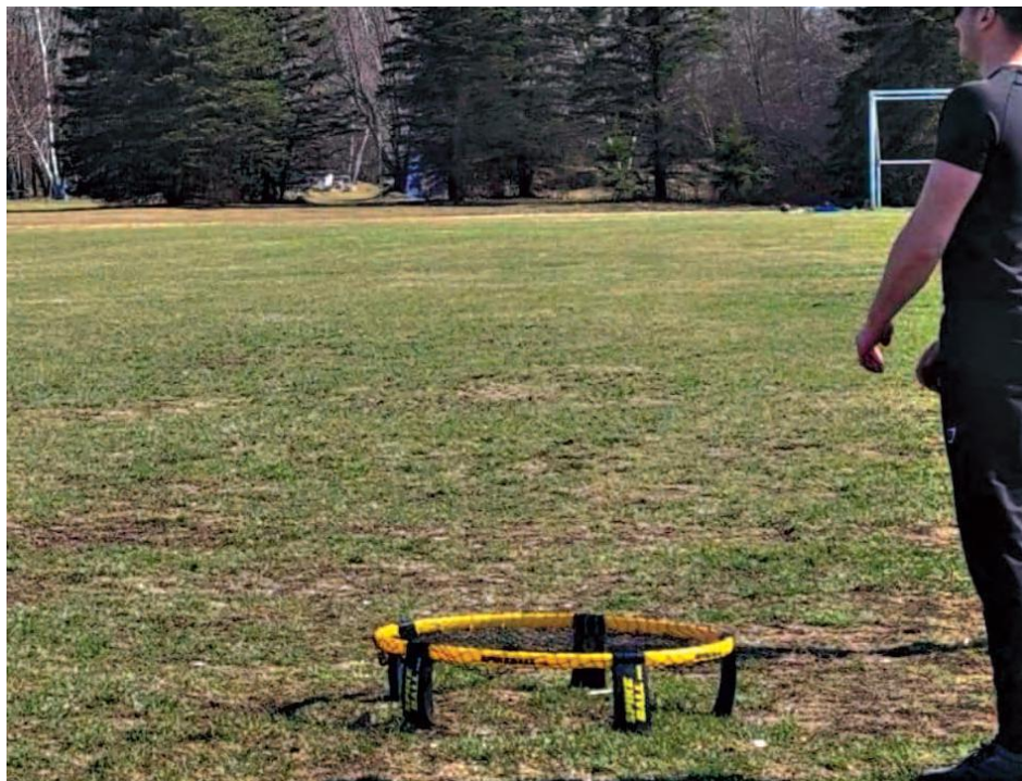
Le trampoline jaune et noir et un petit ballon sont les seuls équipements nécessaires au spikeball .

Afin de permettre aux nombreux adeptes de roundnet de pratiquer leur sport en toute sécurité et dans la plus grande convivialité, la Ville a tracé au sol quatre aires de jeu, c'est-à-dire quatre cercles de 17 pieds (5,18 mètres) de diamètre. Pour pouvoir se livrer à leur activité préférée, les gens n'ont donc qu'à apporter leur filet et leur balle au parc Marie-Victorin.