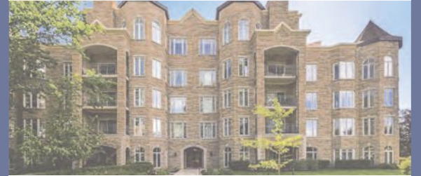
270, DE VIMY, APP. 206 SAINT-BRUNO-DE-MONTARVILLE