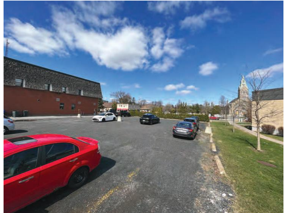
Le site du parc éphémère est situé entre la Caisse Desjardins et la caserne.

Ce lieu aménagé au centre-ville permettra de nouveau aux jeunes de 16 à 25 ans de tisser des liens, de développer un sentiment d'appartenance avec leur milieu et d'avoir un lieu sécuritaire, surveillé et encadré, où ils pourront socialiser et développer des relations significatives. « Un endroit central, éloigné des habitations, plus sécuritaire et à proximité du centre-ville », illustre le maire au Journal de Saint-Bruno .