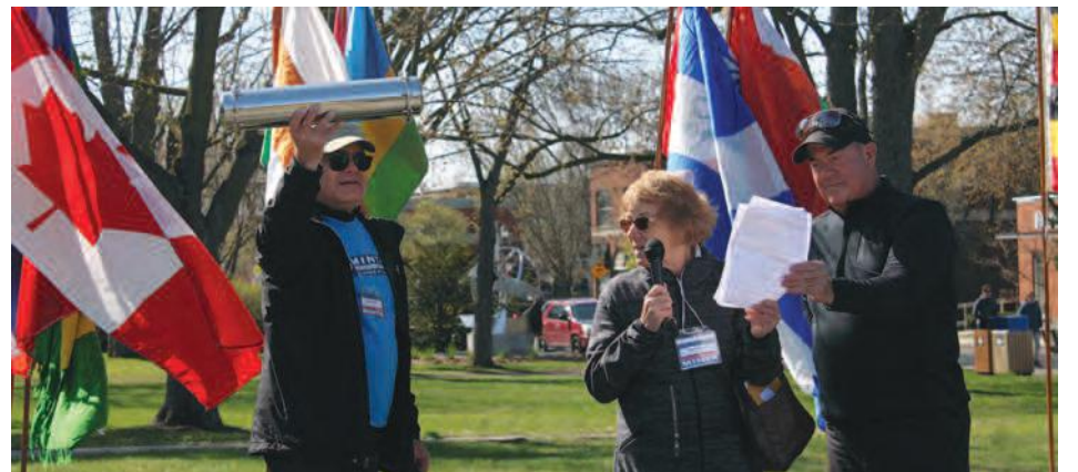
C'est dans cette capsule temporelle que se trouvent les différentes visions du monde de 2045 des citoyens.