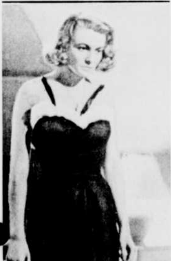
«Le Rebelle», lundi à 11 h 30, à la télévision.