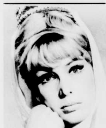
«Jinny», lundi à 19 h 30, à la télévision.