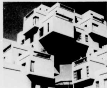
Quel meilleur exemple que Habitat 67 peut illustrer le rôle du dessinateur!