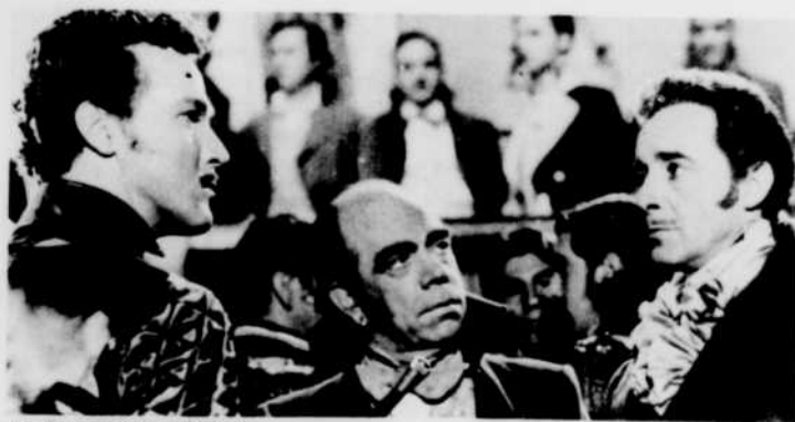
«Le Serment de l'épée»

Drame psychologique et social réalisé par Marcel Carné, avec Pascale Petit, Jacques Charrier, Laurent Terzieff et Andréa Parisy. Un garçon se joint à une bande qui vit d'expédients et dont les loisirs laissent à désirer. Il aime une jeune fille du groupe. Ils voudraient bien s'avouer leur amour, mais les règles du milieu le leur interdisent.