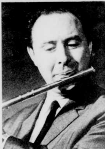
Jean-Pierre Rampal, à «Ad lib», mardi à 13 h 15.