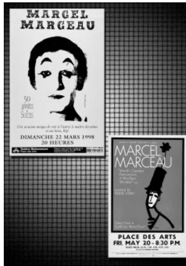
À trente ans de distance, deux passages du célèbre mime Marcel Marceau.