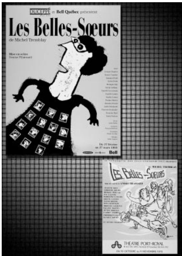
La pièce Les Belles-Sœurs a été présentée au Théâtre Port-Royal en 1973 et en 1993.

tions qui ont contribué à faire de Montréal l'une des capitales de la danse contemporaine sont également présentes : les noms de Jean-Pierre Perreault, de O Vertigo ou encore du Festival international de la nouvelle danse évoqueront sans doute d'agréables souvenirs chez les amateurs. On est de plus frappé par l'importante présence étrangère dans ce domaine. Au fil des ans, des affiches annoncent le passage, parmi bien d'autres, du Ballet Bolchoï de Moscou et de troupes en provenance du Sénégal, de la Moldavie, de la Hongrie, des Philippines et du Cambodge. Dans un autre domaine enfin, il faut souligner la présence de deux affiches témoignant de la venue du légendaire mime Marcel Marceau, d'abord dans les années 60, puis en 1998.