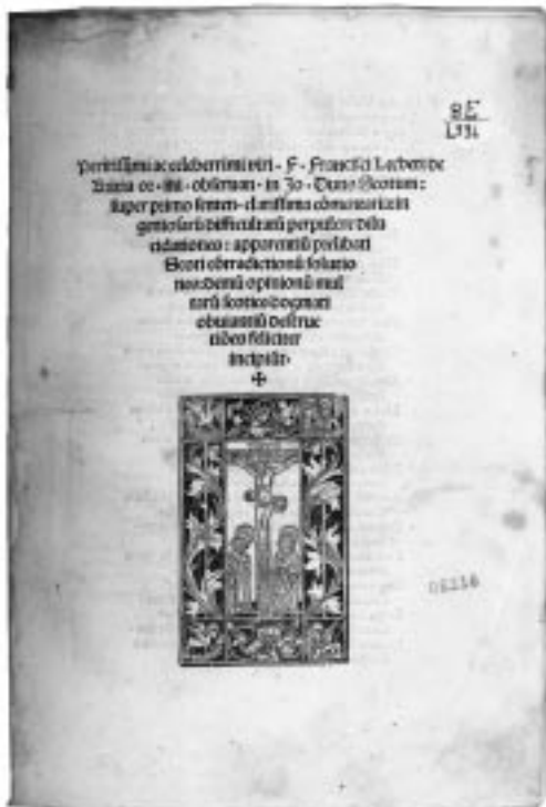
Page de titre d'un ouvrage de Francesco Licheto que l'on peut consulter dans la banque de données Iris.