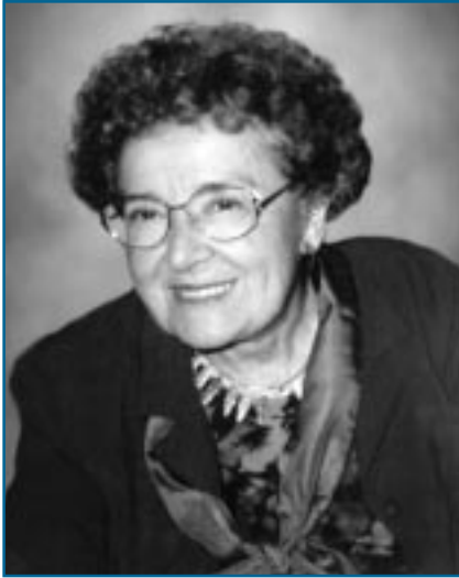
Rina Lasnier, en 1992.

semble contient maintenant près de six mètres d'archives. Le tout favorisera les recherches sur l'œuvre de cette femme dont la parole poétique est l'une des plus marquantes de notre histoire littéraire. Son apport a d'ailleurs été souligné par l'octroi de nombreux prix, dont le prix David, en 1943, pour La mère de nos mères , le prix Duvernay, en 1957, le prix Molson, en 1971, le prix France-Canada, en 1973-1974, le prix David, de nouveau, en 1974, pour l'ensemble de son œuvre et le prix français Edgar-Poe de la Maison de poésie, en 1979.