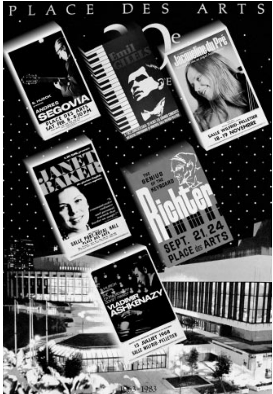
Quelques-uns des grands interprètes étrangers qui se sont produits à la Place des Arts.

D'autre part, les grands interprètes étrangers ne sont pas en reste. On constate ainsi que Montréal fait, depuis longtemps, partie du circuit qu'empruntent les tournées des grands virtuoses. Il suffira de citer quelques noms pour évoquer des souvenirs très forts chez certains mélomanes ou susciter l'envie chez d'autres : Jacqueline du Pré, Vladimir Ashkenazy, Andrés Segovia, Janet Baker, Mstislav Rostropovitch, Sviatoslav Richter, Emil Gilels ou Nelson Freire, qui sont venus