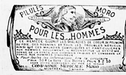
L'Etiquette est de papier blanc imprimé en bleu.

COMPAGNIE MEDICALE MORO, 1724, rue Ste-Catherine, Montréal.