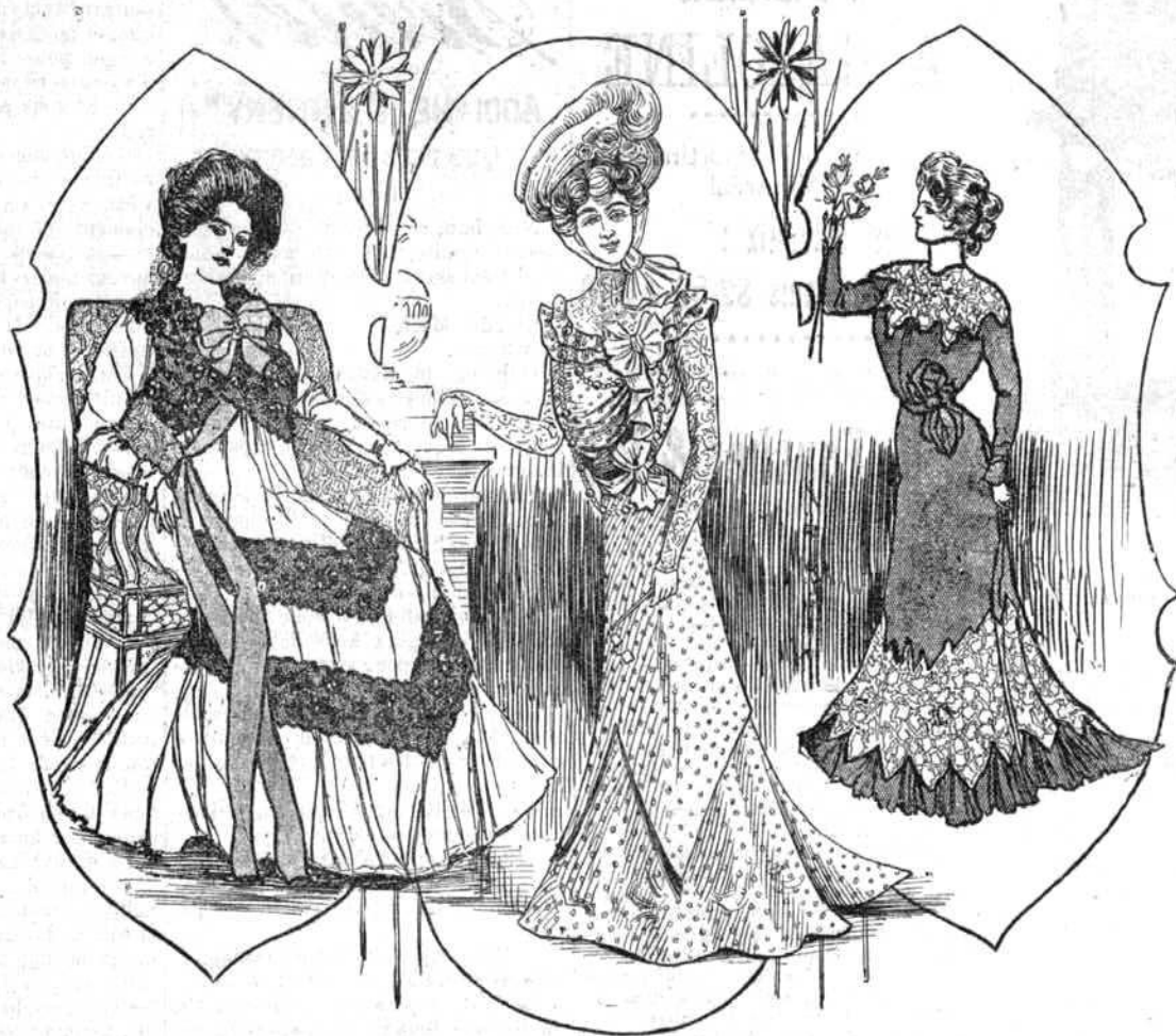
TOILETTE DE PROMENADE ET ROBES D'INTERIEUR.