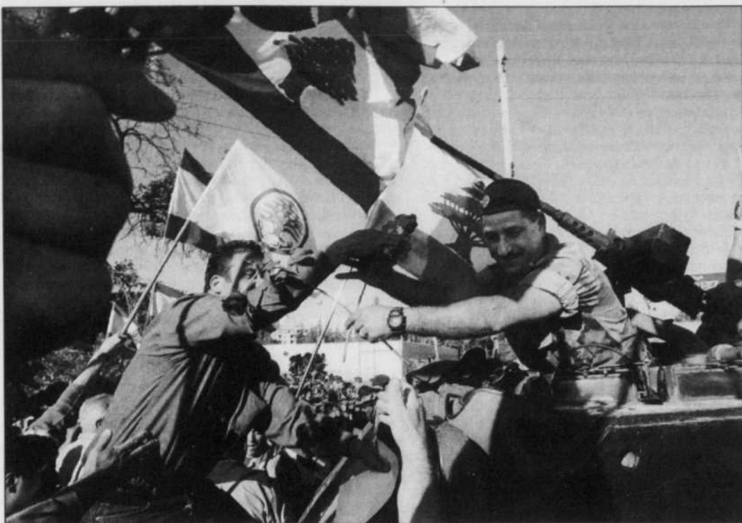
Le départ des militaires et surtout des agents de renseignement syriens et leur remplacement par des Libanais ont été accueillis avec joie dans la vallée de la Bekaa.

Adoptée en septembre 2004 à l'initiative de Washington et Paris, cette résolution réclame le départ du Liban des soldats syriens, la fin de l'ingérence de Damas dans les affaires intérieures de son petit voisin et