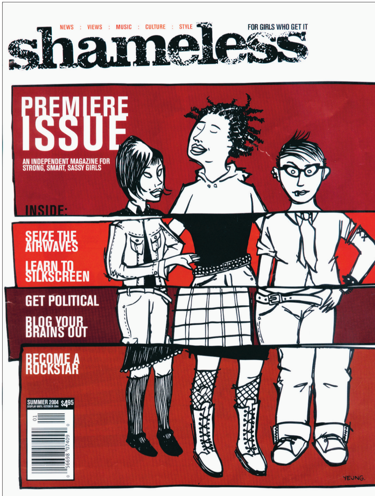
Un exemplaire du premier numéro de Shameless .

Pour arriver à concrétiser leur projet, les filles sont allées chercher des conseils d'éditeurs de métier, ont beaucoup discuté avec des adolescentes, et se sont aussi entourées d'une douzaine de filles pour les conseiller sur la ligne rédactionnelle à adopter. « On ne voulait pas tenir pour acquis qu'on savait déjà quels sujets les intéressaient, reprend Nicole. Contrairement aux autres magazines d'ados, souvent dirigés par des femmes de 30 à 40 ans, déconnectées de leurs années adolescentes, qui donnent l'impression de vouloir revivre leur jeunesse, mais en mieux, nous on a une