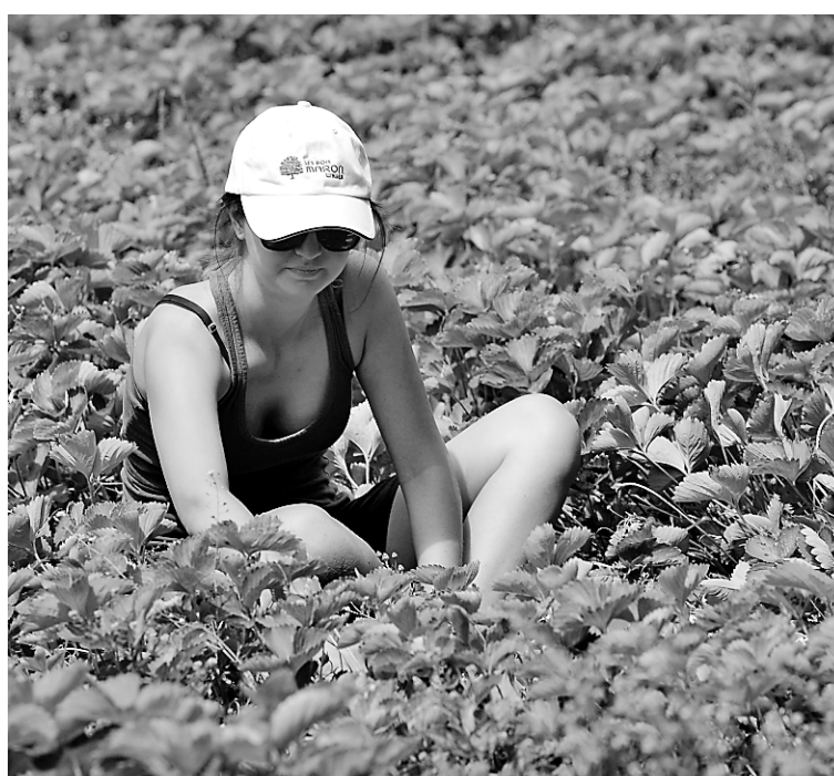
La cueillette des fraises et des framboises est un des emplois agricoles facilement accessibles aux jeunes.

Pour les autres récoltes, il semble que l'embauche de jeunes soit plus difficile.