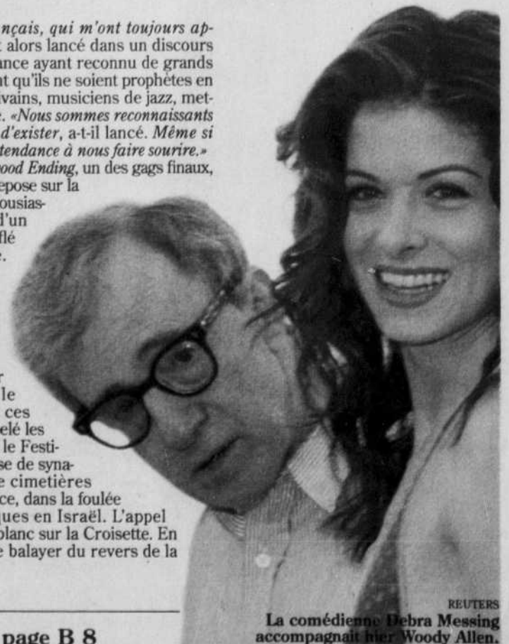
La comédienne Debra Messing accompagnait hier Woody Allen.