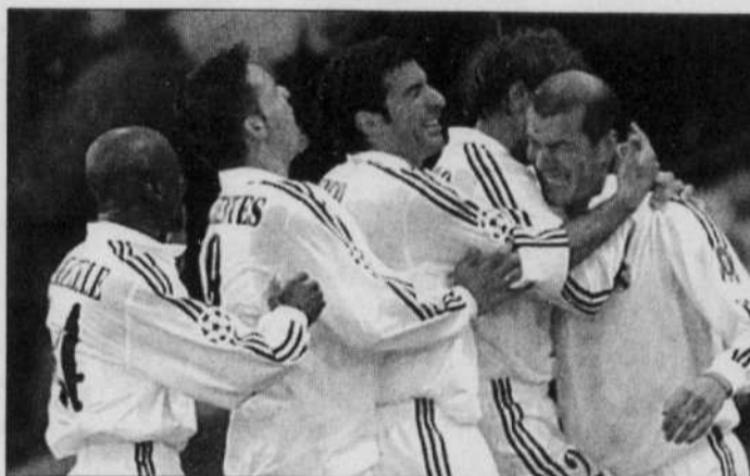
DESMOND BOYLAN REUTERS

LE REAL MADRID a remporté pour la neuvième fois de son histoire la plus prestigieuse des compétitions européennes hier soir en battant le Bayer Leverkusen 2-1 à l'Hampden Park de Glasgow. L'année de son centenaire, sous les yeux de 350 millions de téléspectateurs, le Real a sauvé une saison médiocre au niveau national, et permis au Français Zinedine Zidane (à droite), auteur du but victorieux de son équipe, de remporter son premier titre européen en club. Vainqueur des cinq premières Coupes d'Europe des clubs champions entre 1956 et 1960, le Real en a remporté une autre en 1996, avant de conquérir deux Ligues des champions en 1998 et 2000. Zidane, le héros de la rencontre, ne rejoindra pas ses partenaires de l'équipe de France en stage à Clairefontaine. En raison de l'accouchement programmé de sa femme, il a été dispensé de la rencontre amicale France-Belgique de samedi.